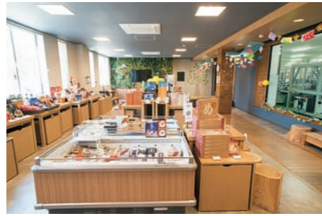
■ 添田町めんべい工場 廃校の体育館を改装して建てられた工場。製造の様子を見学できるお土産ショップのほか、女子ソフトボールチームの創設など、地域ににぎわいをもたらしている