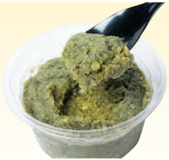
■ 柚子ごしょう 地元産の柚子をたっぷり使った柚子ごしょうは、季節を問わず人気。英彦山の山伏が保存食として作ったのが始まりといわれている