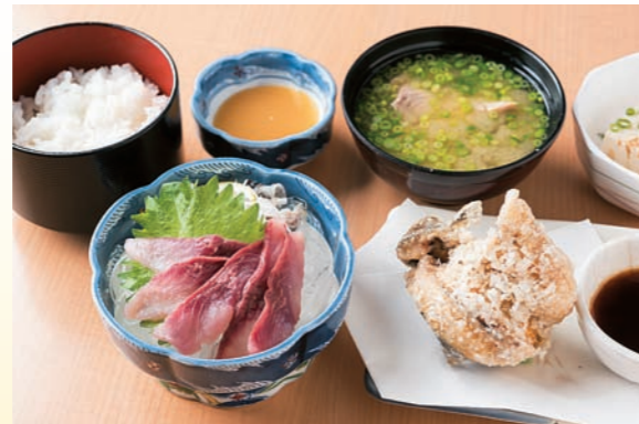
■ 川魚 町内には、鯉のあらいやヤマメの唐揚げなど、清らかな水が育んだ川魚を楽しめるお店が多数。川魚特有の臭みが無く、あっさりとした食感で美味