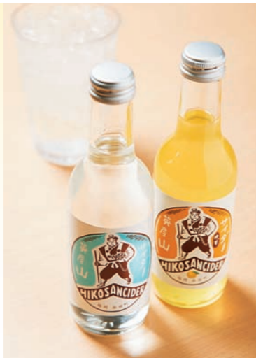
■ 英彦山サイダー 添田町の地下水を使用したスッキリ爽やかな味わいのサイダー。柚子果汁を使ったタイプも好評。道の駅などで販売中