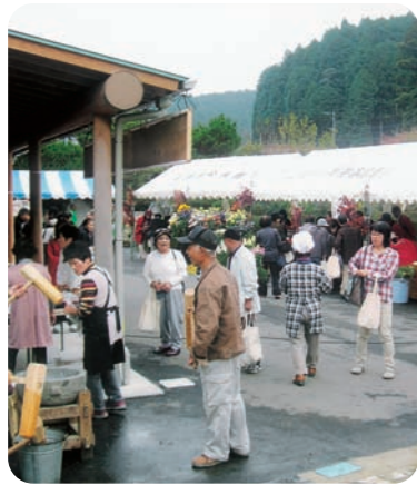
収穫祭は、クチコミにより年々参加者も増加。県外からの観光客の姿も目立つ