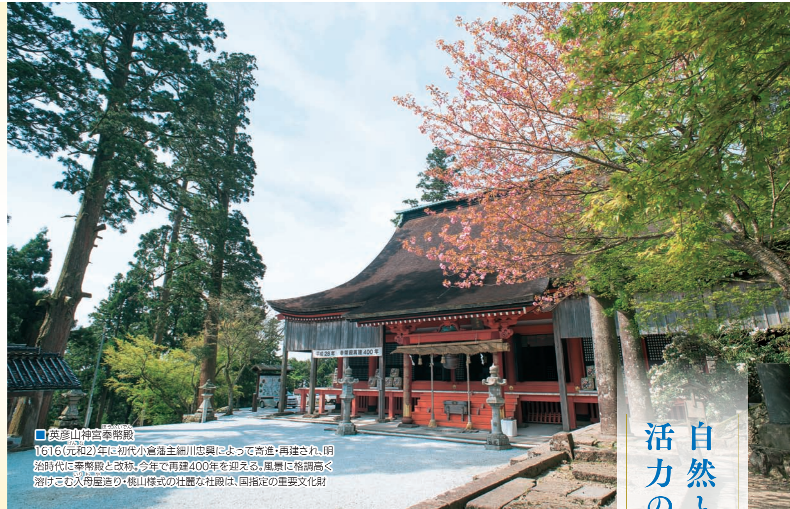
■ 英彦山神宮奉幣殿 1616(元和2)年に初代小倉藩主細川忠興によって寄進・再建され、明治時代に奉幣殿と改称。今年で再建400年を迎える。風景に格調高く溶けこむ入母屋造り・桃山様式の壮麗な社殿は、国指定の重要文化財