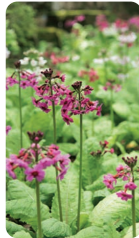
周辺は珍しい植物の宝庫