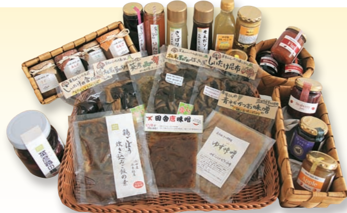
■ 添田ブランド 味噌やしいたけを使った素朴な味わいの総菜から、あんずやいちごを使った果実のジャムまで、地元のお母さんたちが町の特産品を使って作る加工品が人気