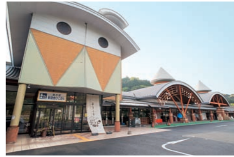
■ 道の駅 歓遊舎ひこさん 今年4月にリニューアルオープン。物産館には町自慢の逸品が勢揃い。人気のバイキングレストランでは鯉のあらいも堪能できる