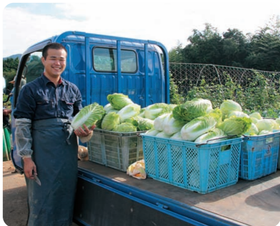
自ら育てた野菜の収穫の喜びはひとしお