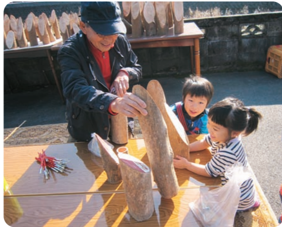
昨年11月に開催した第1回「姫活祭」の様子