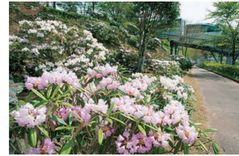
■ 英彦山花園 スロープカーの「花駅」そばにある花園。高山植物を中心に70種類以上、3万2千本以上の花木が植樹されている。シャクナゲやラベンダーなど、季節の花を楽しむことができる