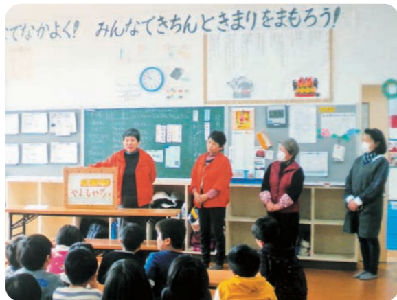
添田小学校学童保育所での環境学習。子どもたちに木材の良さを分かりやすく伝えるために手づくりの紙芝居を行う