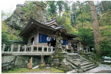
■ 高住神社 豊前坊天狗神として有名で、天狗伝説の地としても知られる。本殿は岩の中にのめり込むように建立されている