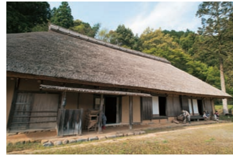
■ 旧数山家住宅 1842(天保13)年に建てられた豪農の邸宅。開放的な屋敷と広間が特徴。原型をよくとどめており、国の重要文化財に指定されている。見学無料