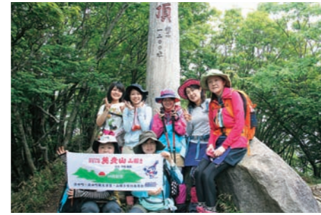
■ 英彦山 涼やかな夏の新緑や秋の紅葉を求めて、一年を通してたくさんの登山客が訪れる英彦山。貴重な野鳥や植物の宝庫であり、修験の山としての趣も楽しめる