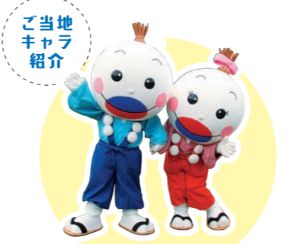
「ひこちゃん」「うずちゃん」 英彦山がらと山伏をモチーフに、町制施行100周年を記念して誕生しています。

福岡県の東南部、英彦山の麓で豊かな自然の恵みを受けながら発展を遂げてきた添田町。平成23年に町制施行100周年を迎えました。 耶馬(やば) 耶馬日田英彦山国定公園の四季折々の風景のほか、修験道(しゆげんどう)の影響を色濃く残す歴史や文化が古来より受け継がれています。また、近年、英彦山はパワースポットとしても注目を浴びています。 町では、今年度中の英彦山の国の史跡指定を目指しており、「歴史のまち」としての新たな活力も生まれています。