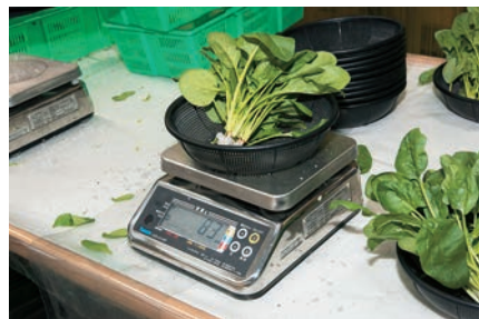
障害者の皆さんは青果の仕分けや袋詰め、シール貼りなどの作業を担当。誰にでも使いやすい機械を導入することで、生産性も向上している