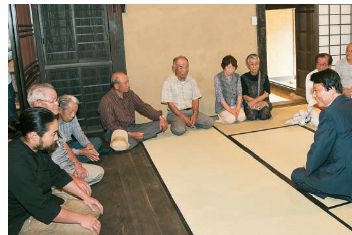
地区の皆さんから現在の様子や、うきはボサーダを活用した今後の展望などについて説明を受けた

新川田地区の川沿いにある集落は、茅葺民家と棚田がつくる山里の風景が広がる。注連原住宅(愛称:うきはボサーダ)は、平成24年の九州北部豪雨で被害を受けた古民家を再建築した施設で、宿泊も可能。来年のオープンを予定している