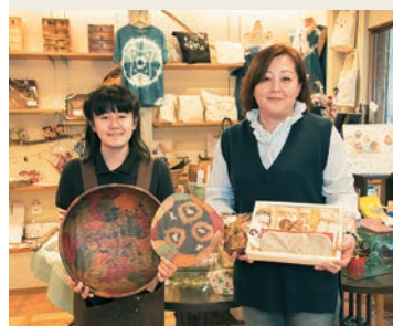
「二丁目の元気」(北九州市小倉北区京町) 障害者自立支援ショップ

障害者の皆さんが制作した商品を販売するほか、各種イベントが開催され、地域交流の拠点となっている。店内にはカフェもあり、数量限定のランチセットが楽しめる。NPO法人北九州小規模連が運営