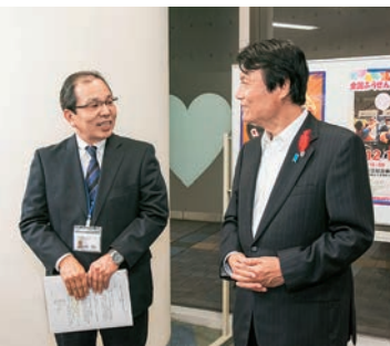
求職活動の支援や関連機関との調整をはじめ、就職後も安定して働けるように職場定着支援にも力を入れている

国・県・北九州市の委託を受け運営される同センターは、障害者の就業・生活支援に取り組んでいる