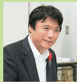
「障害者の皆さまの就労支援、理解促進に社会全体で取り組み、全ての方が生き生きと活躍できる福岡県を目指していきましょう」と知事

障害者の皆さんが制作した商品を販売するほか、各種イベントが開催され、地域交流の拠点となっている。店内にはカフェもあり、数量限定のランチセットが楽しめる。NPO法人北九州小規模連が運営