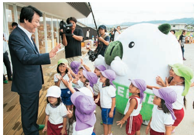
園児たちが元気いっぱい知事を歓迎