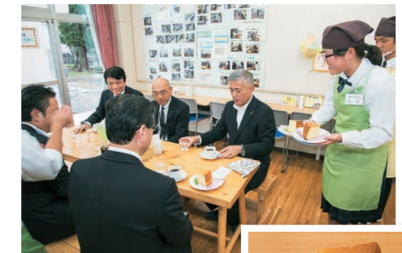
学校内にある喫茶室。学習の一環として、生徒たちがケーキやパンの製造・販売や注文・配膳などの接客も行っている