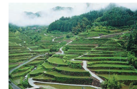
「日本の棚田百選」にも選ばれたつづら棚田