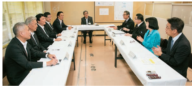
育成会は参加者の取りまとめや現場での作業指示などを行っており、企業と福祉施設の連携が障害者の社会参加の促進や収入向上につながっている