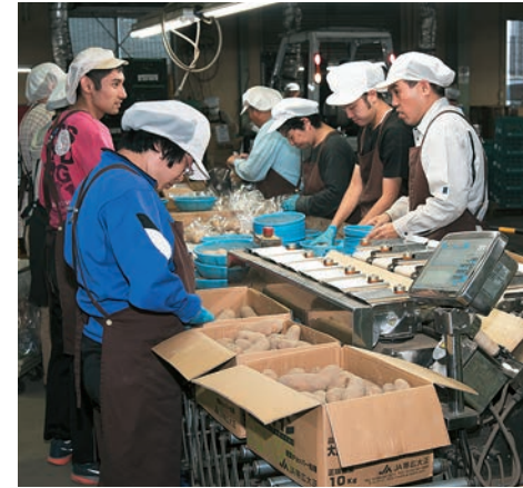
マルキタ流通株式会社は、市内で複数の障害福祉サービス事業所を運営する「北九州市手をつなぐ育成会」に業務を委託。障害者の皆さんは同社の加工場まで出向いて働いている