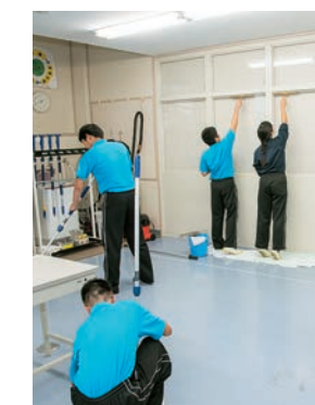
同校の特色である「作業学習」は実践的な技能の習得を目指すもので、清掃や印刷、木工、織物など多様なカリキュラムが組まれている