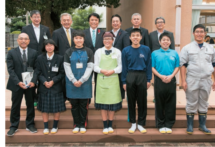
北九州中央高等学園の皆さんと。同校では、生徒たちが将来自立した生活を送り、就業するために必要な力を身に付ける教育カリキュラムを実践