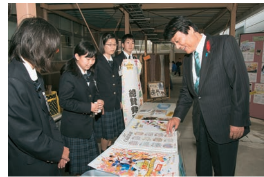
知事が訪れたこの日は学校開放週間の期間中。生徒たちが育てた野菜や苗、オリジナルカレンダーなどの販売が行われた