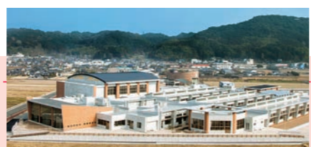
嘉穂小学校の取り組みは今後の大規模木質化の参考になるものとして、賞選考の際に高く評価された

木のぬくもりが溢れる校舎で、元気づけに学ぶ子どもたち。「第2回福岡県木造・木質化建築賞 木質化の部」で大賞を受賞した嘉麻市立嘉穂小学校では、嘉麻産のスギ材がふんだんに用いられています。県平均を上回る森林率約60%の同市では、市内5小学校が統合されるに当たり、「地元の豊かな自然に触れながら学べる場を」と、校舎の木質化に踏み切りました。品質の高い大量の地元産材