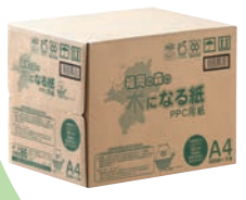
県産材を原料とした「福岡の森の木になる紙」

私たちの安全・安心、そして快適な生活を支えてくれる森林。その機能を最大限に生かすためにも、木材の地産地消は必要なのです。県産材は家具や建築物以外でも、紙製品やおもちゃなどに幅広く活用されています。