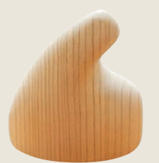
八女産のスギやヒノキを使用した「ぐっポス」。筆記時にペンを持たない側の手で握ることのできる良い姿勢が維持できる

インテリアや木質製品に関する研究開発・技術相談・強度試験などを通して県内中小企業を支援しています。2014年度福岡デザインアワードで大賞を受賞した「ぐっポス」や、薄板を用いた木製容器「木匠シリーズ」など、県産材を用いた商品開発にも力を入れています。