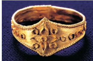
国宝 金製指輪 古墳時代 宗像大社蔵 展示期間:1月31日(火)～3月5日(日)

世界文化遺産の国内候補となった『神宿る島』宗像・沖ノ島と関連遺産群。日本各地で発掘された出土品と、日本最古の歴史書である「古事記」・「日本書紀」に記された神話を交差させながら、大和朝廷を基盤に成立する「神宿る島」宗像・沖ノ島の源に迫ります。