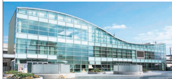
JR博多南駅と直結した博多南駅前ビル。町民情報ステーションや会議室、パスターミナルなどがあり、町の玄関口としての役割を担う