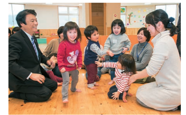
この日行われていたプログラムに知事も飛び入り参加。子どもたちと一緒にゲームを楽しんだ