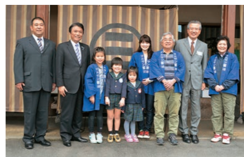
1910(明治43)年創業のマルサン醤油。那珂川町のきれいな水が醤油づくりの源となっている