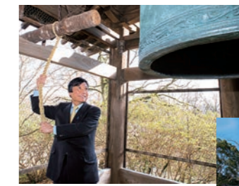
日本最古といわれる国宝の梵鐘を鳴らす知事。菅原道真も聴いた鐘の音が響いた