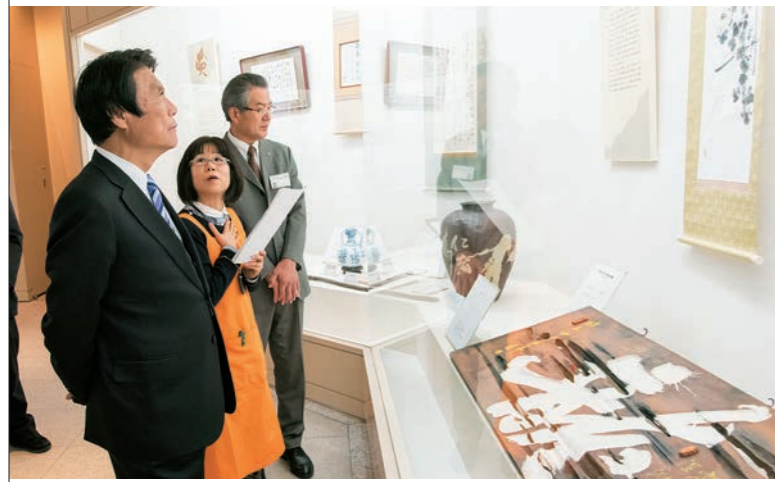
那珂川町に生まれた月城は開業医として地域の医療に貢献する傍ら、漢詩や書道などの分野でも才能を発揮。館内には貴重な資料や書画などが展示されている