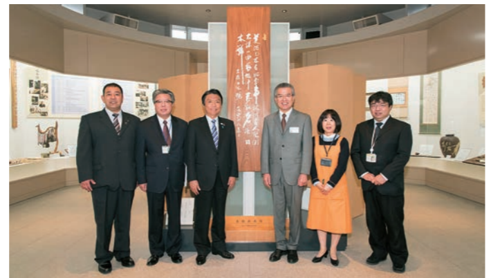
月城の代表作である「名檀日本号」の詩の前で