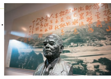
月城は吟詠漢詩家としても全国的に知られ、生涯で1万数千首に及ぶ漢詩を作ったとされる