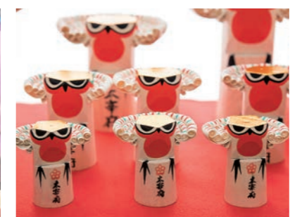
太宰府天満宮の「鳥替え神事」で用いられる「木うそ」。これまでの悪いことを「嘘」にして今年の吉に取り替えるなどの意味がある