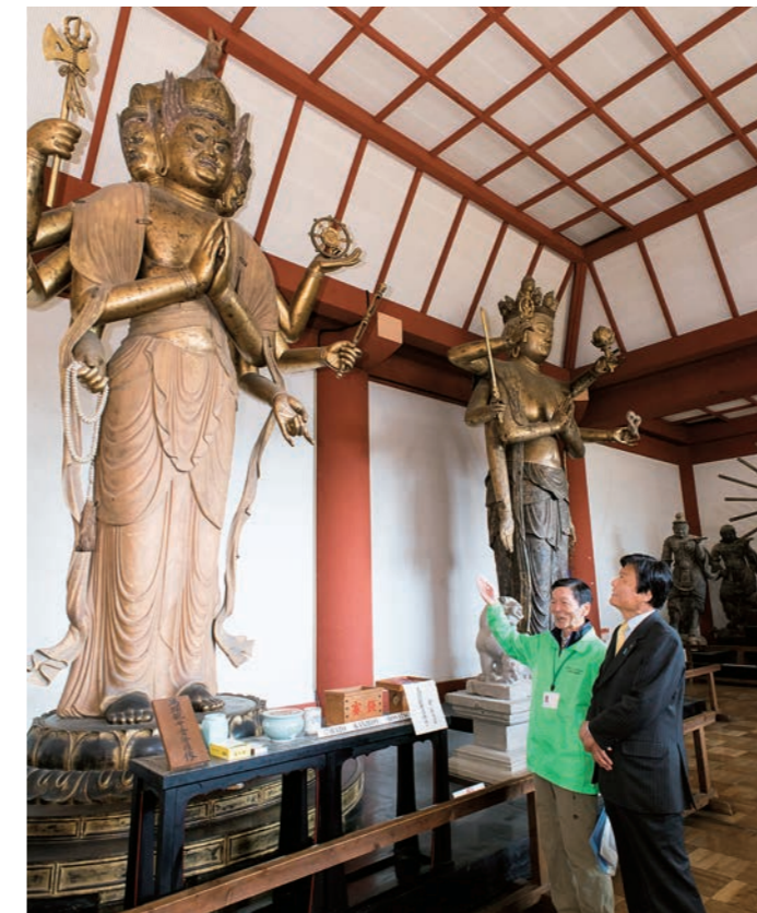
宝蔵には平安・鎌倉時代の仏像16体が収められている。最も大きな木造馬頭観音立像は像高約5m