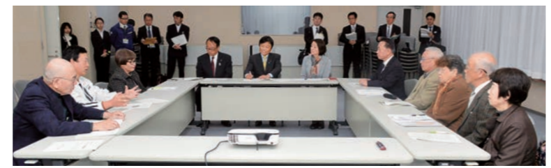
広場のスタッフの皆さんと懇談。知事は「広場の運営を支えるボランティアの皆さんには心から感謝します」とお礼を述べた