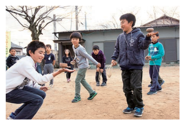
子どもたちの居場所づくりとして県内各地に開設されているアンビシャス広場。今回訪れた国分アンビシャス広場では多くの子どもたちが「和ごま」遊びに夢中になっている