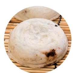
太宰府名物の梅ヶ枝餅づくりも体験。自分で焼いた出来立ての餅は味も格別