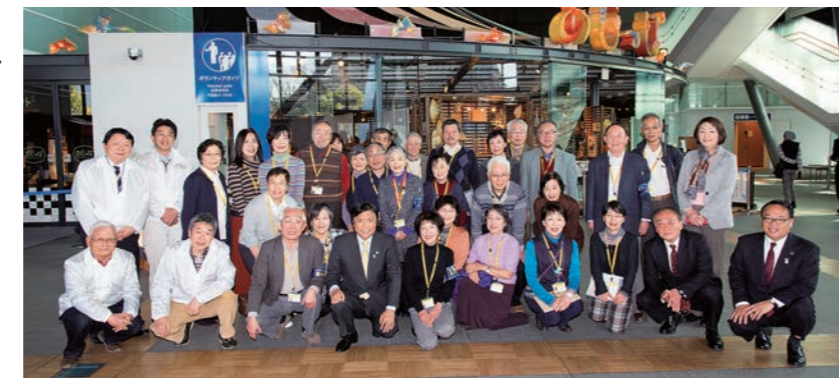
館内案内や展示解説を行うボランティアや「九州国立博物館を愛する会」など、多くの人たちの支えが同館の盛り上がりにつながっている