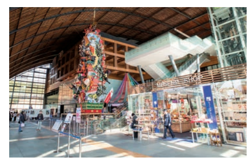
国内4番目の国立博物館として平成17年に開館。開館以来の来館者数は1400万人を超える