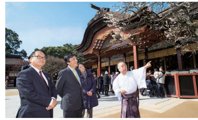
太宰府天満宮の由来や歴史について説明を受ける知事。「学問・至誠・厄除けの神様」として天神様(菅原道真)を祀るこの場所には年間800万人の参拝客が訪れている