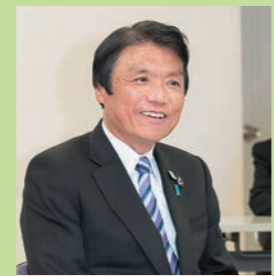
「子育て支援や移住定住促進への取り組み、市制施行へ向けた町の皆さんの努力に改めて敬意を表したい」と知事