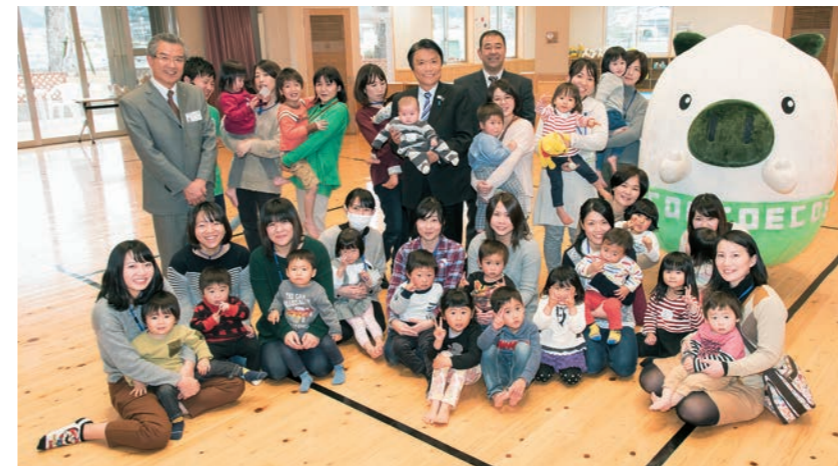
利用者の皆さんと。子育て支援センターと児童館の機能を兼ね備えた同館は那珂川町の子育て支援の拠点となっている