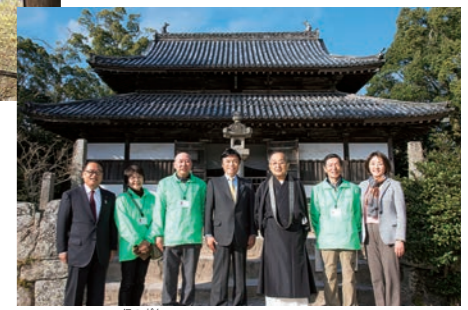
天智天皇の発願によって建てられた観世音寺は数多くの文化財が残る国指定史跡