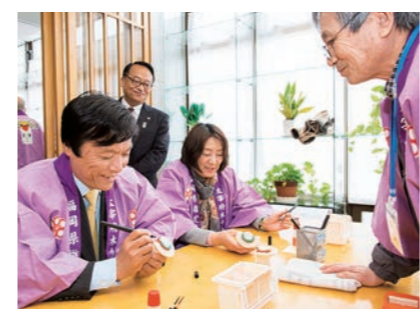
太宰府館では木うその絵付けなどの体験プログラムや太宰府観光の情報収集が可能