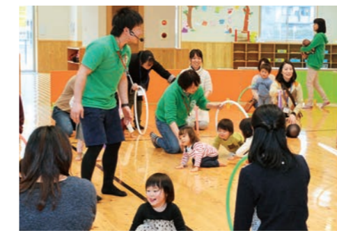
就学前の子どもと保護者が参加する「すくすく広場」。手遊びや工作などさまざまなプログラムが用意されている