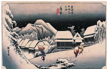
東海道五拾三次之内 蒲原 夜之雪(保永堂版)

本展では、広重生誕220年にあたり、代表作「東海道五拾三次」シリーズのほか、江戸や全国各地の名所絵など、主要な版画作品約150点を紹介します。広重の特徴ともいえる繊細な自然描写やユーモラスな人物描写など、広重の風景世界に迫ります。