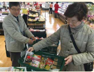
2月に実施されたフードドライブ活動では、多くの食材が寄付された

特定非営利活動法人チャイルドケアセンターは、長年、大野城市を中心に乳幼児の子育て支援や学童保育を運営し、子どもたちと日々触れ合う中で、「地域の大人も巻き込んで、この子どもたちの元気を地域に広げ、地域を活性化できないか」と考えました。そこで、人が集まりみんなが笑顔になる子ども食堂の継続的な支援を目的に、寄付された食材を子ども食堂に届ける「ふくおか筑紫フードバンク」を立ち上げました。企業や行政、子ども食堂を運営する地域の方々や協働し、それぞれの得意分野を生かして支え合うことができるようなネットワークづくりを進めています。