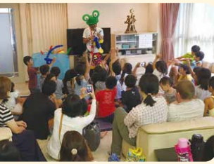
ボランティアによる催し物を通じて、子どもたちは遊びや学びの体験を深める