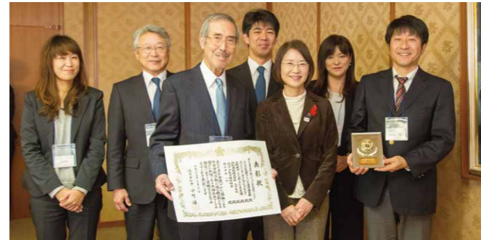
平成29年度「ふくおか共助社会づくり表彰」を受賞した「ふくおか筑紫フードバンク」の関係者の皆さん

「ふくおか共助社会づくり表彰」は、NPOの社会的な信頼性向上を図るとともに、NPOや企業、行政などによる協働の優れた取り組みを、県民の皆さんに広く発信するものです。