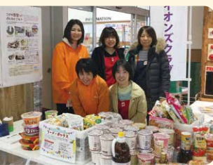
フードドライブ活動の実施回数はまだ少ないが、今後も定期的に継続する予定