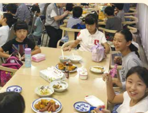
食事中には子どもたちに笑顔があふれる

「ふくおか地域貢献活動サポート事業」を活用して活動を活発化し、「ふくおか共助社会づくり表彰」を受賞した、子ども食堂の運営を支援するフードバンク活動を行う「ふくおか筑紫フードバンク」の取り組みをご紹介します。