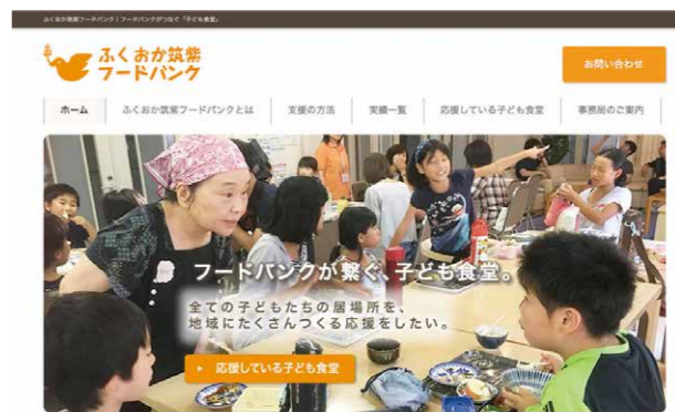
このホームページは、「ふくおか地域貢献活動サポート事業」を活用し、作成された。広報の充実など、NPOの活動支援の方法の一つとしても活用されている

お預かりした寄付は、基金の主旨に沿った活動を支援する「ふくおか地域貢献活動サポート事業」に活用しています。