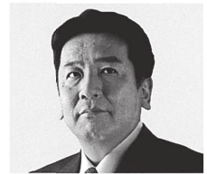
立憲民主党 代表 枝野幸男

国民のみさんの日常の暮らし、現場のリアルな声に根ざした、 ボトムアップの政治を実現する。それが私たちの描く、日本の未来です。右でも左でもなく、前へ。