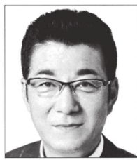
代表 松井 一郎