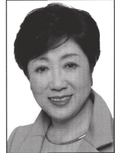
希望の党代表 こいけ ゆりこ 小池 百合子