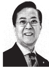
よこやま 新一 現 元農林水産大臣政務官、参院議員1期。 北海道大学大学院修士課程単位取得、56歳。 “地方創生”で未来を創る。 実現力の男。