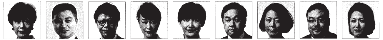
●問い合わせ先/「国民怒りの声」事務局 http://kokumin-no-koe.com/ 東京都港区新橋2-16-1 704B TEL.03-5510-9020 FAX.03-3502-1661