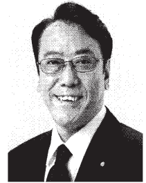
ながさき ひろあき 現 参院災害対策特別委員長。 参院議員1期、東洋大学卒、57歳。 庶民とともに行く。