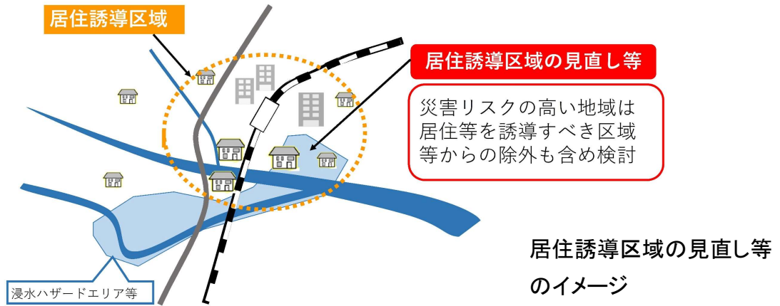
居住誘導区域の見直し等のイメージ

引き続き災害の発生のおそれのある土地の区域においては、居住誘導区域からの除外も含め、長期的・全市的な視点で区域の見直しを図る。