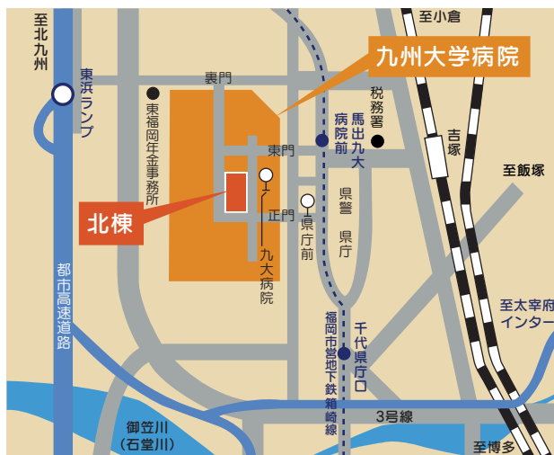
〈福岡センターアクセス図〉

ご相談は、各分野の相談員が電話・メール・面談の方法でお受けしておりますので、お気軽にご連絡ください。