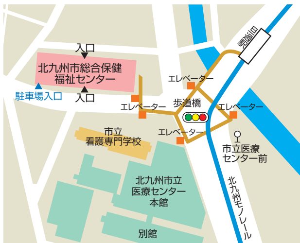
〈北九州センターアクセス図〉

〒802-8560 北九州市小倉北区馬借1-7-1 北九州市総合保健福祉センター6階