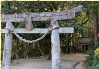
英彦山・宝満修験の入峯の道筋で、山伏の修行の場だった社です。