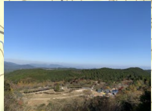
大型遊具や芝生広場がある、豊かな自然に囲まれた公園です。