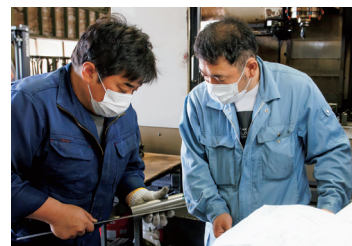
▲ 機械の操作には、熟練の職人の知識が欠かせない。