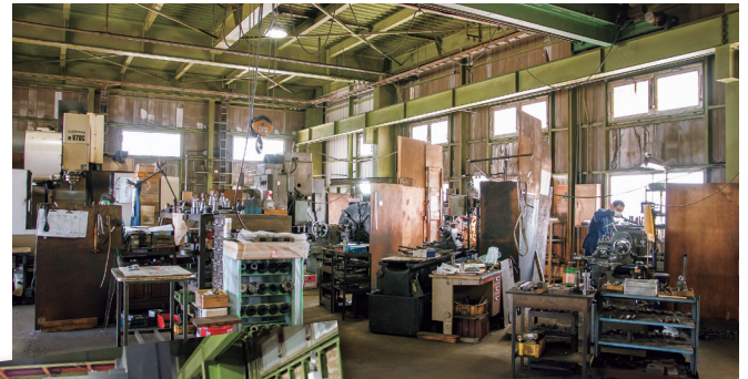
▲ 最新のマシニングセンタ。

独自の技術を守りながら、地域のニーズにくまなく対応できる会社でありたいと考えています。一昨年秋に亡くなった父は、一代で会社を築き上げた職人でした。父の夢だった「加工から組み立てまでできる工場」を、いつか実現したいと思っています。