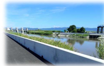
<河川の護岸整備(工事後)>