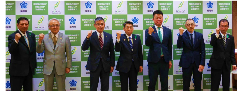
＜採択を受けた際の県とボナックによる共同記者会見＞

（※）国立研究開発法人日本医療研究開発機構（AMED）公募事業。令和3年4月にボナックを中心とした核酸医薬を用いた治療薬の開発事業（総事業費50億円）が採択された。