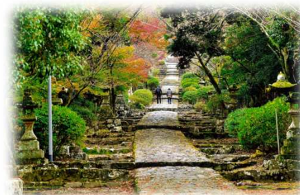
<英彦山神宮の参道>