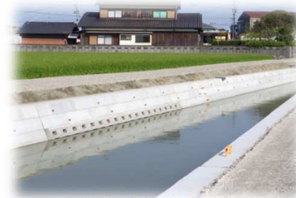
<用排水路整備(工事後)>