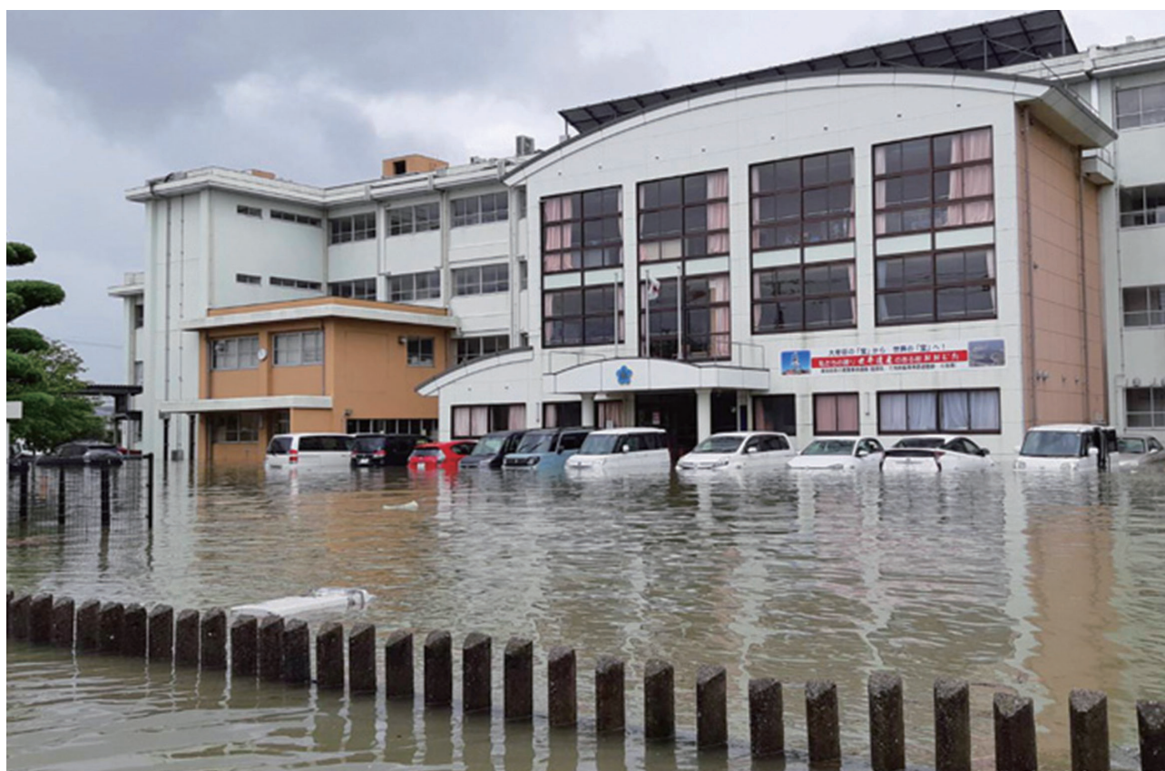
おおむ た しりつ しょうがく せい 水につかった大牟田市立みなと小学校

おおむ た しりつ しょうがく せい 大牟田市立みなと小学校6年生 さい がい ねん せい (災害にあったときは5年生)