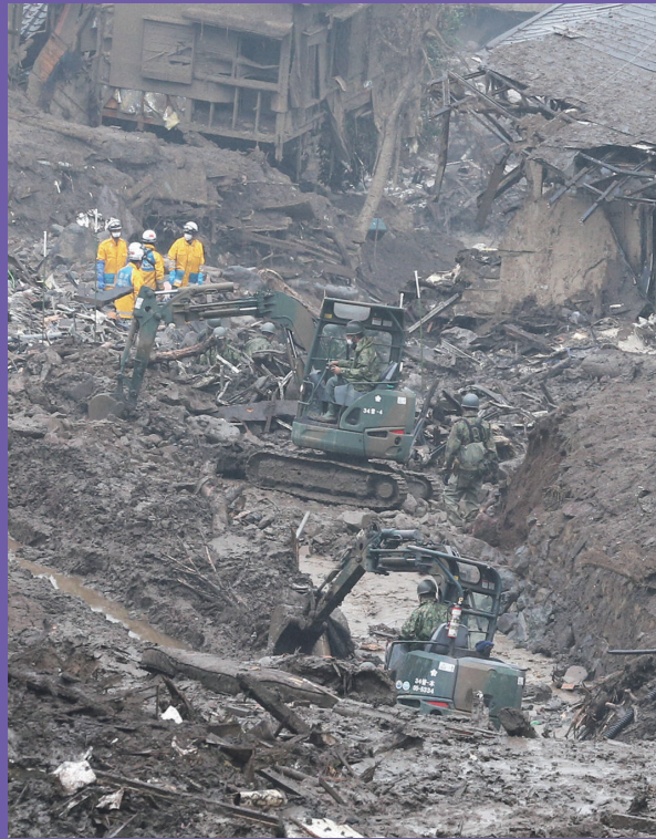
がそうていきょう まいにちしんぶんしや

れいわ ねん (2021年) ねん しずおかけんあたみ し ど さいがい 令和3年(2021年)静岡県熱海市の土しや災害