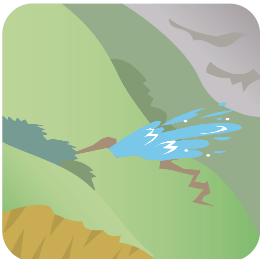
● じめん みず だ 地面から水がふき出す。