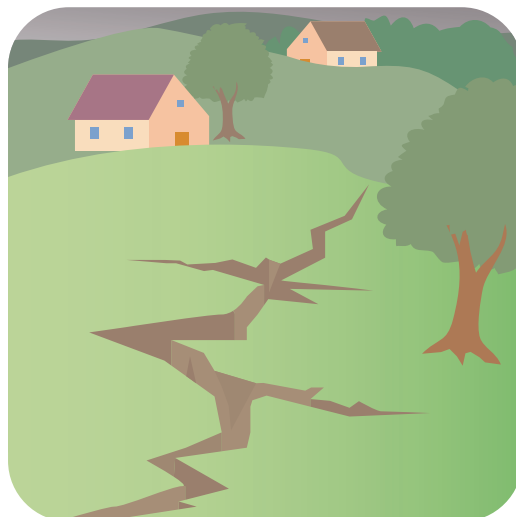
● じめん はい 地面にひびが入る。