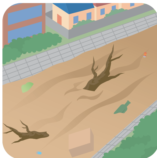
● かわ みず き 川の水がにごって、たおれた木も いっしょにながれてくる。