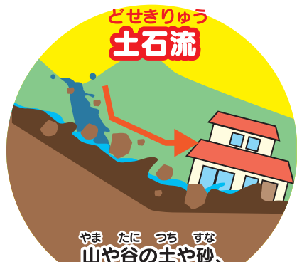
どせきりゅう 土石流

あめ 雨がしみこんで、 じめん やわらかくなった地面が、 おお 大きなかたまりのまま、 お すべり落ちるのです。