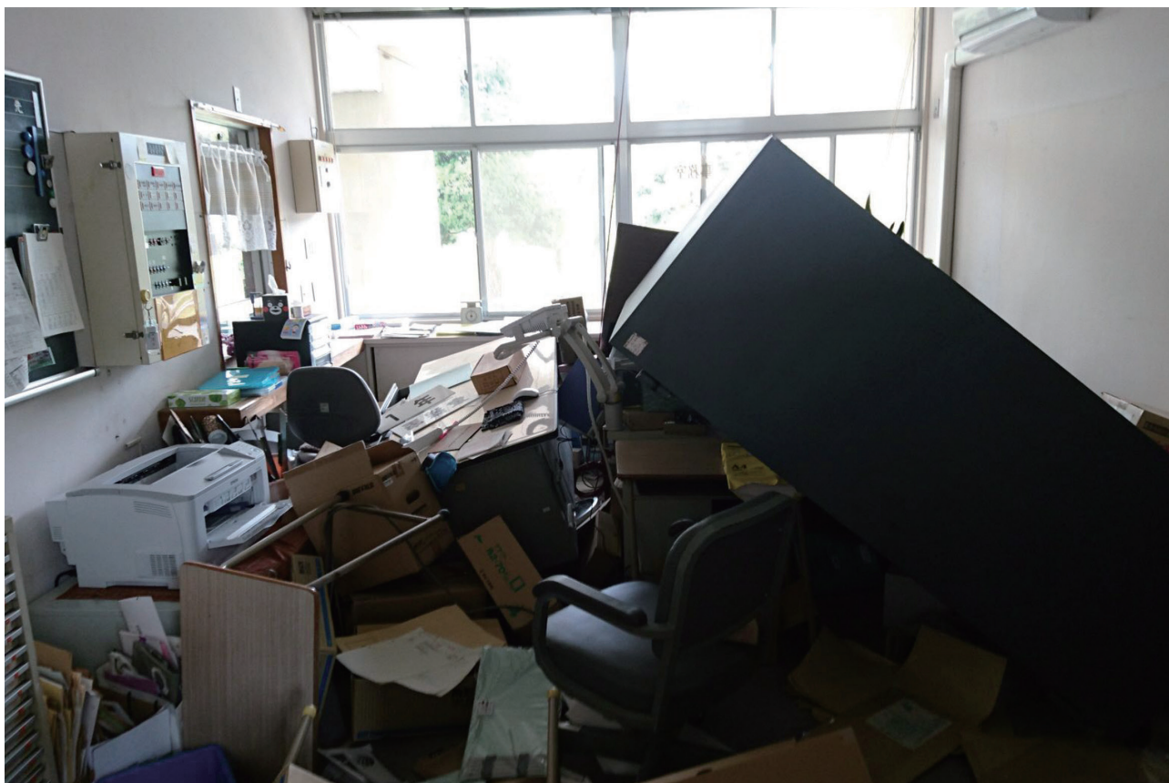
じしん じしつ 地しんでいろいろなものがたおれた事む室