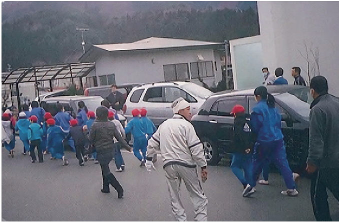
平成23年東日本大しんさい当日、いっしょにひなんする 釜石東中学校生徒と鶴住居小学校の児童たち