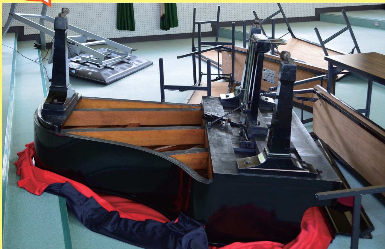
じ 地しんでさかさまになったグランドピアノ