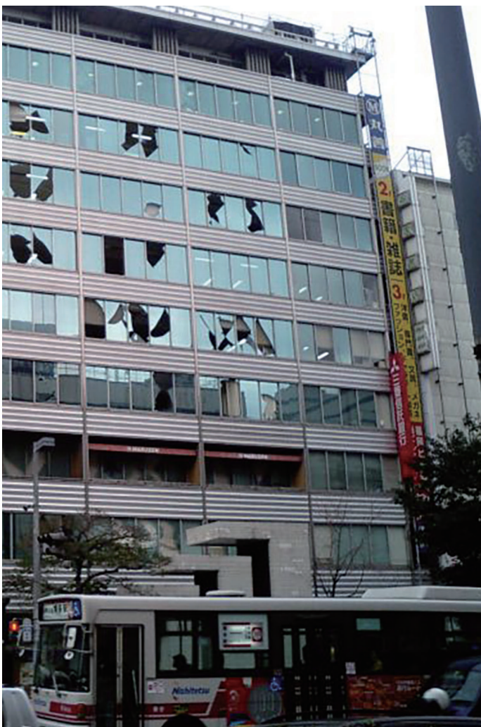
平成17年3月福岡市内 まどがわれたビル (画像提供:「Wikipedia」)