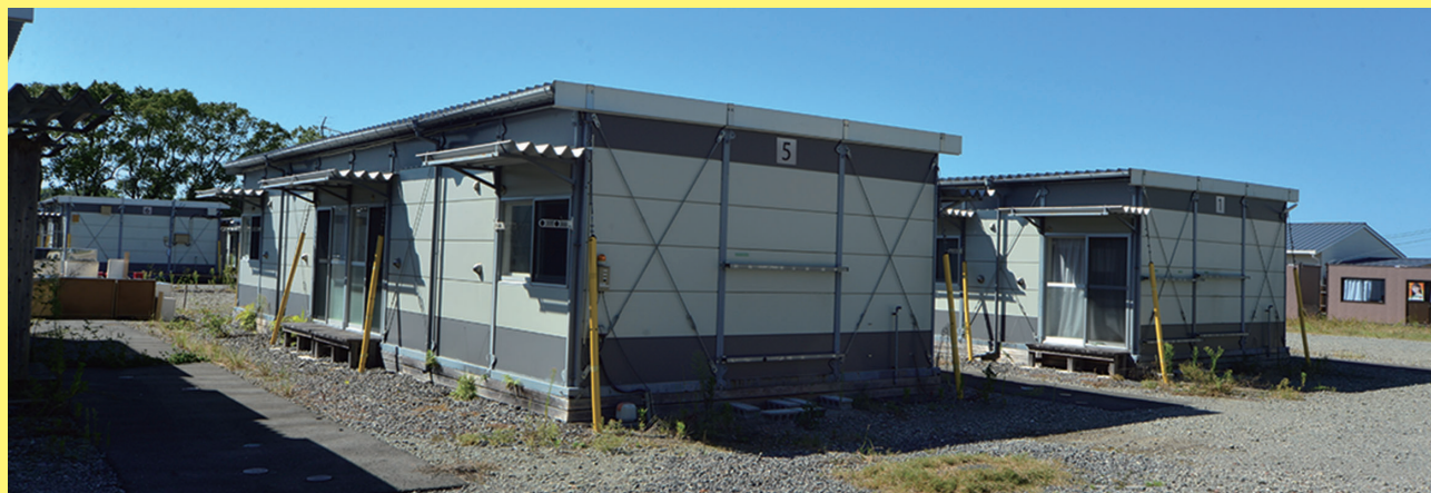
うんどうじょう 運動場にたてられた、かせつじゅうたく（ す 住んでいた家 いえ に災害で住めなくなった人 ひと のための家 いえ ）

じ 地しんのあとすぐにひなんしてきた まち 町の人たちで たいいくかん 体育館がいっぱいになりました。グランドピアノがさかさまになっていて、おどろきました。