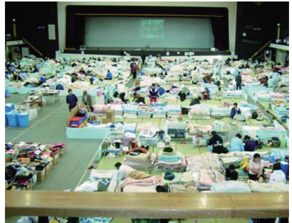
平成17年3月福岡市九電記念体育館 ひなん所の様子