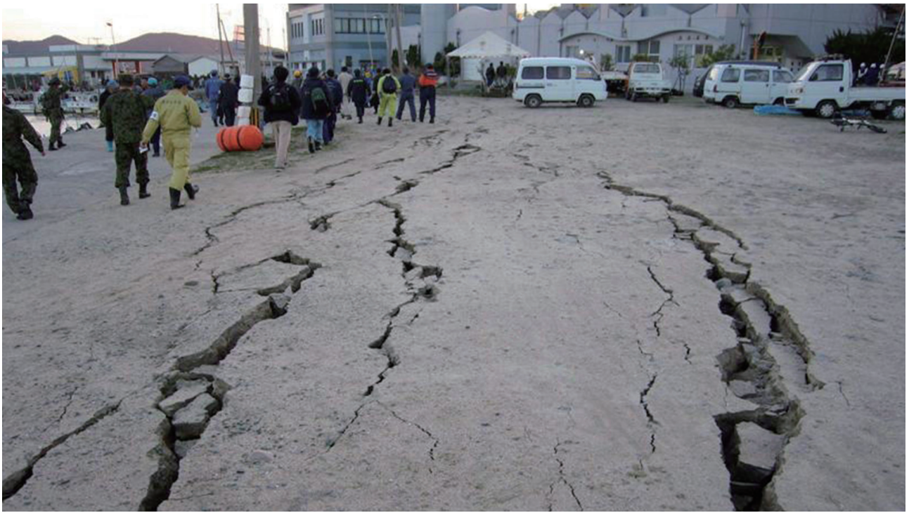
平成17年3月福岡県内 地われがおきた地面