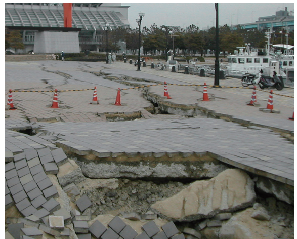
平成17年3月博多埠頭付近 地われでくずれた地面