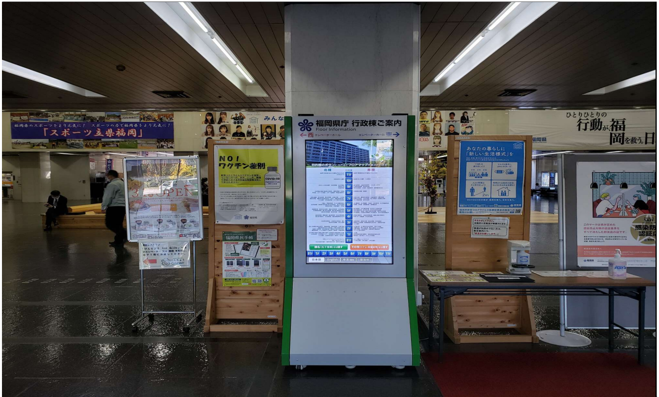
《設置箇所C：1階 南側玄関ロビー》