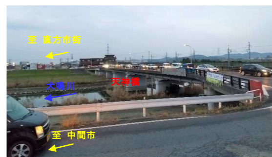
写真②：植木交差点の渋滞状況