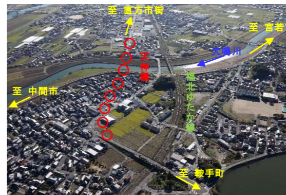
写真①：天神橋周辺の全景