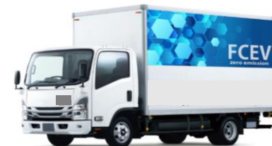
<水素を燃料とするFCTトラック>

[補助要件] 運行により得られたデータ（航続距離や燃費など）の報告、試乗会の実施等