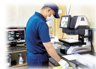
<検査工程のデジタル化>