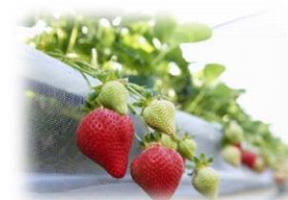
<18年連続販売単価日本一を達成した「あまおう」>