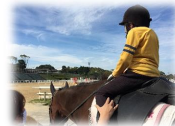
<馬とのふれあい体験>