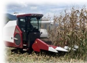
<子実用とうもろこし収穫機>