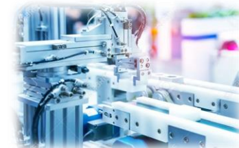
<自動化された生産ライン>