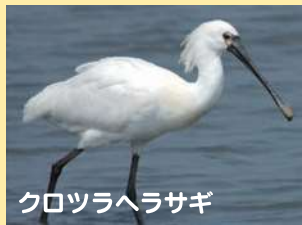
クロツラヘラサギ

生きものたちを守るために、まず、福岡県にどのような生きものがすんでいるのかを知ることが大切なんだよ。