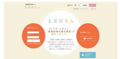
「とどけるん」のトップページ