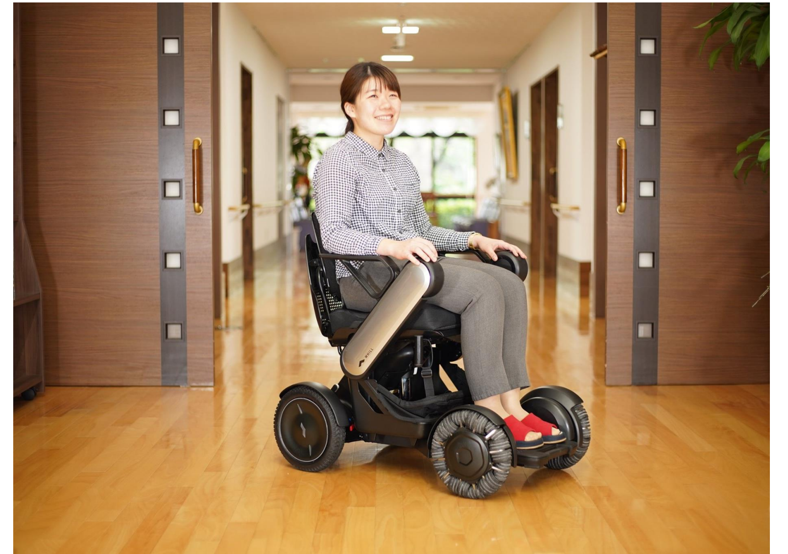
入所者が自由に移動でき、職員の業務負担を軽減する 未来の自動車いすを久留米大学と共同で検証中

近い将来、介護職は深刻な人材不足になると言われており、高齢職員の労働力は非常に重要です。一方で、高齢職員は将来への不安があります。このため、そのスキルを生かしながら多様な働き方ができる場を提供し、生涯に渡って活躍できるようにすることを目指しました。併せて、最新介護機器の導入やICTを活用し職員の負担を軽減することにより、満足度を向上させて離職率を減らすことが、サービスの質を高めることにつながると考えました。