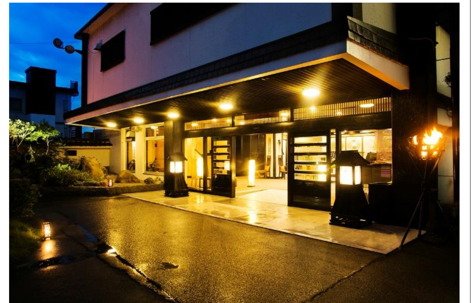
夕景の宿 海のゆりかご 萩小町 外観

萩市内の人口は年々減少傾向にあり、特に若年層については就職希望者が少ない状況です。一方で、高齢者でも「まだまだ働ける」という方からは応募や問い合わせがあり、経験・未経験を問わず意欲のある方が知り合いの紹介等を通じ徐々に増えつつある状況です。今後も、この状態が続くと思われることから、高齢者雇用に力を入れることとしました。