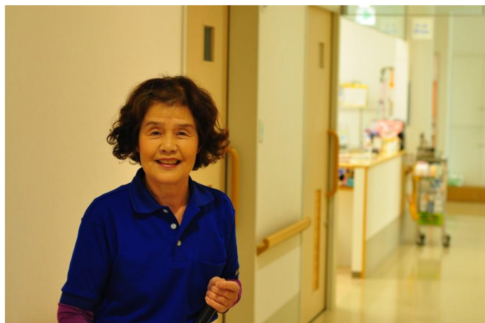
「きれい好き」を活かして働いています

ビルメンテナンス業界はもともと高齢者・障がい者雇用の受け皿的な存在。定年年齢を70歳に引き上げ、シニア人材を積極的に雇用していることでもあります。社員同士がシニア・障がい者等の区別なく「共に働く仲間」との思いで接しています。また、社員が無理なく働ける様々な雇用形態、就業場所を提供しており、定着率が非常に高いです。