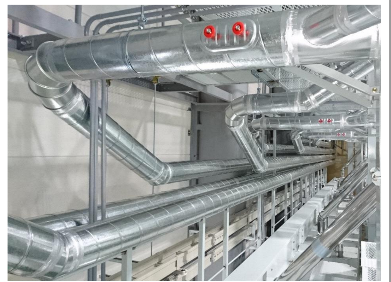
集塵ダクト設置工事現場

少子高齢社会において人手不足が進行していく中、高齢者をはじめ障がい者、主婦層などの雇用を積極的に進めていく必要性を感じていました。高齢者雇用を推進していく中で、雇用環境の工夫により、知識、人脈、経験と高い就業意欲を持つ高齢者の存在は、経営に好影響をもたらすこともわかってきました。今後とも「多様な人材が個々の能力を最大限に発揮できる企業」を目指してまいります。