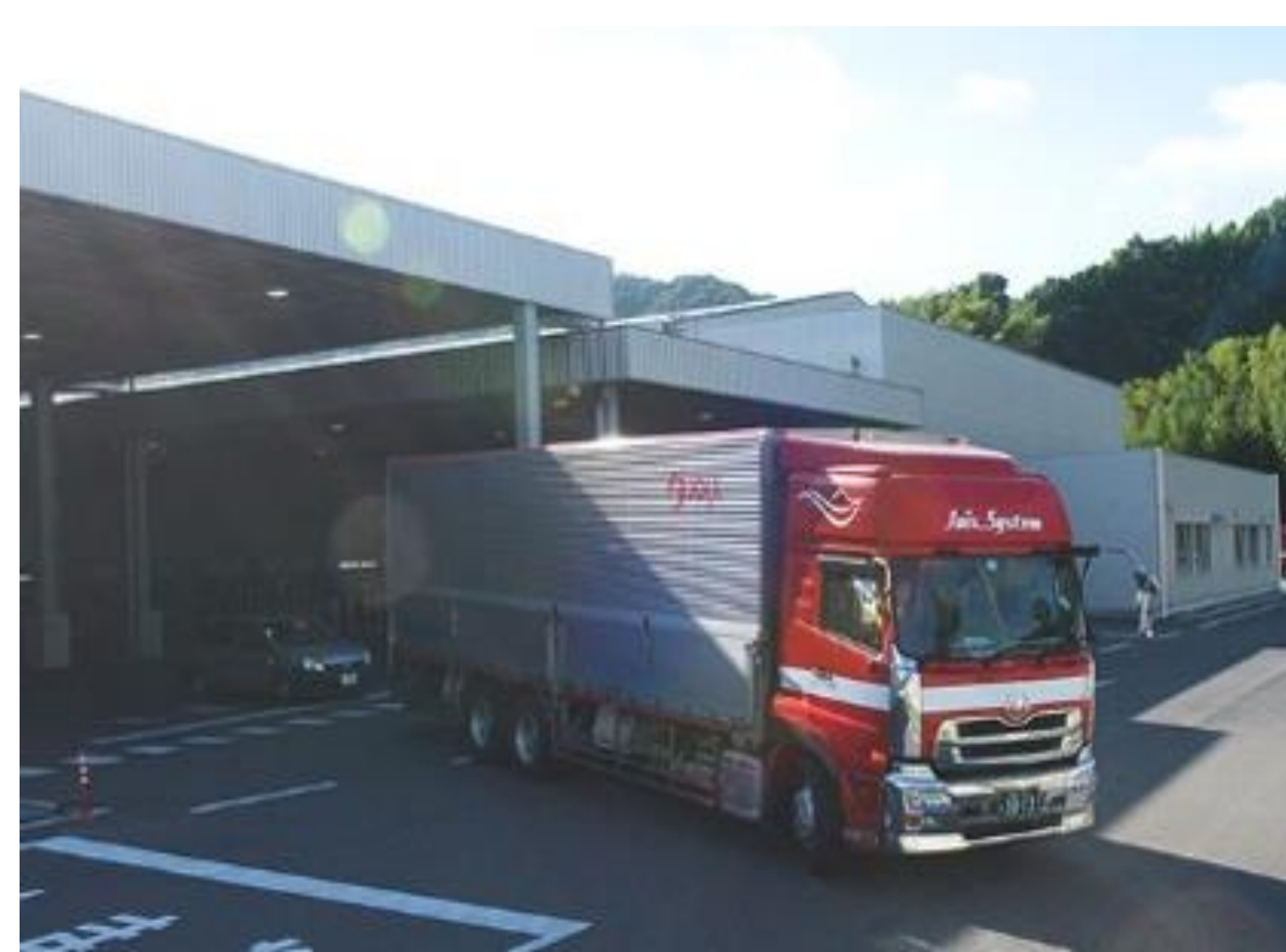
環境に配慮した車両とトラックヤード

高齢者の熟練技術は会社の宝です。この技術と経験を若い世代に継承してもらうこと、また、大きな戦力として社業に尽力してもらう必要がありました。さらに、ベテラン社員の仕事への情熱や誇りは、会社や後輩社員へ刺激と好循環をもたらしてくれます。このように様々な角度から会社に貢献していただいている高齢者に少しでも長く活躍いただきたいと考えたところです。