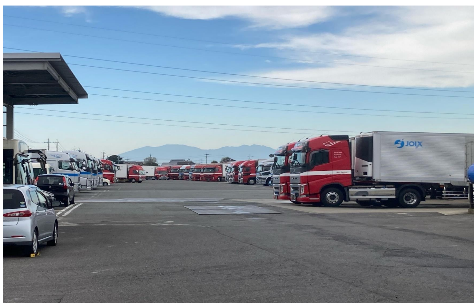
先端技術が搭載されたトラックが並ぶ本社