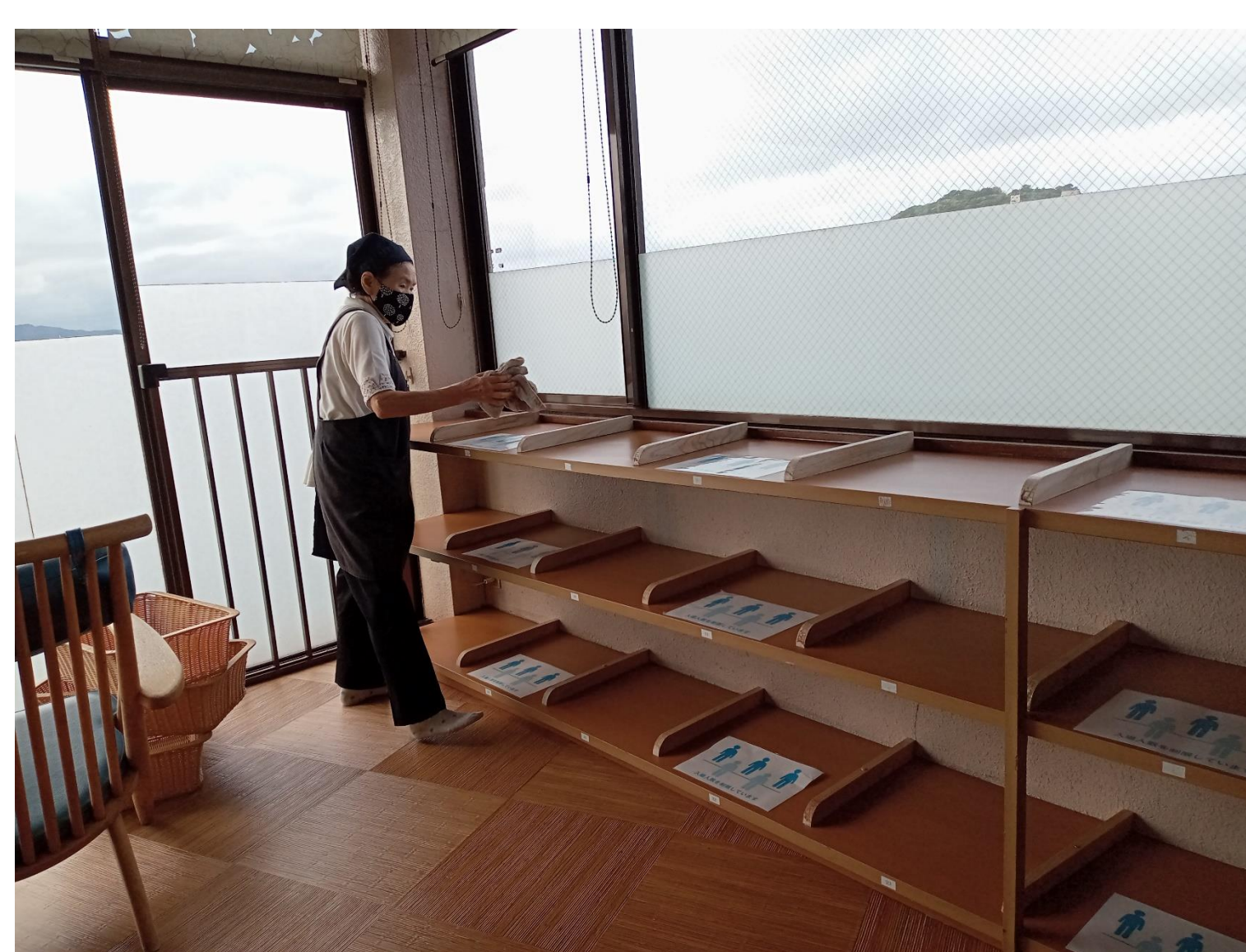
大浴場脱衣場の清掃作業の様子