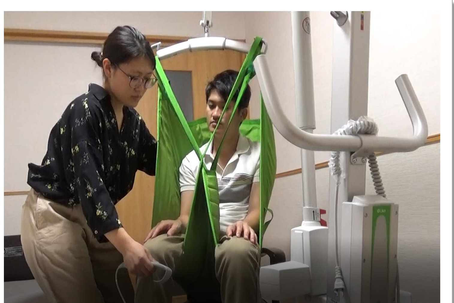
最新の福祉用具（リフト）の導入により 抱えない介護を実現