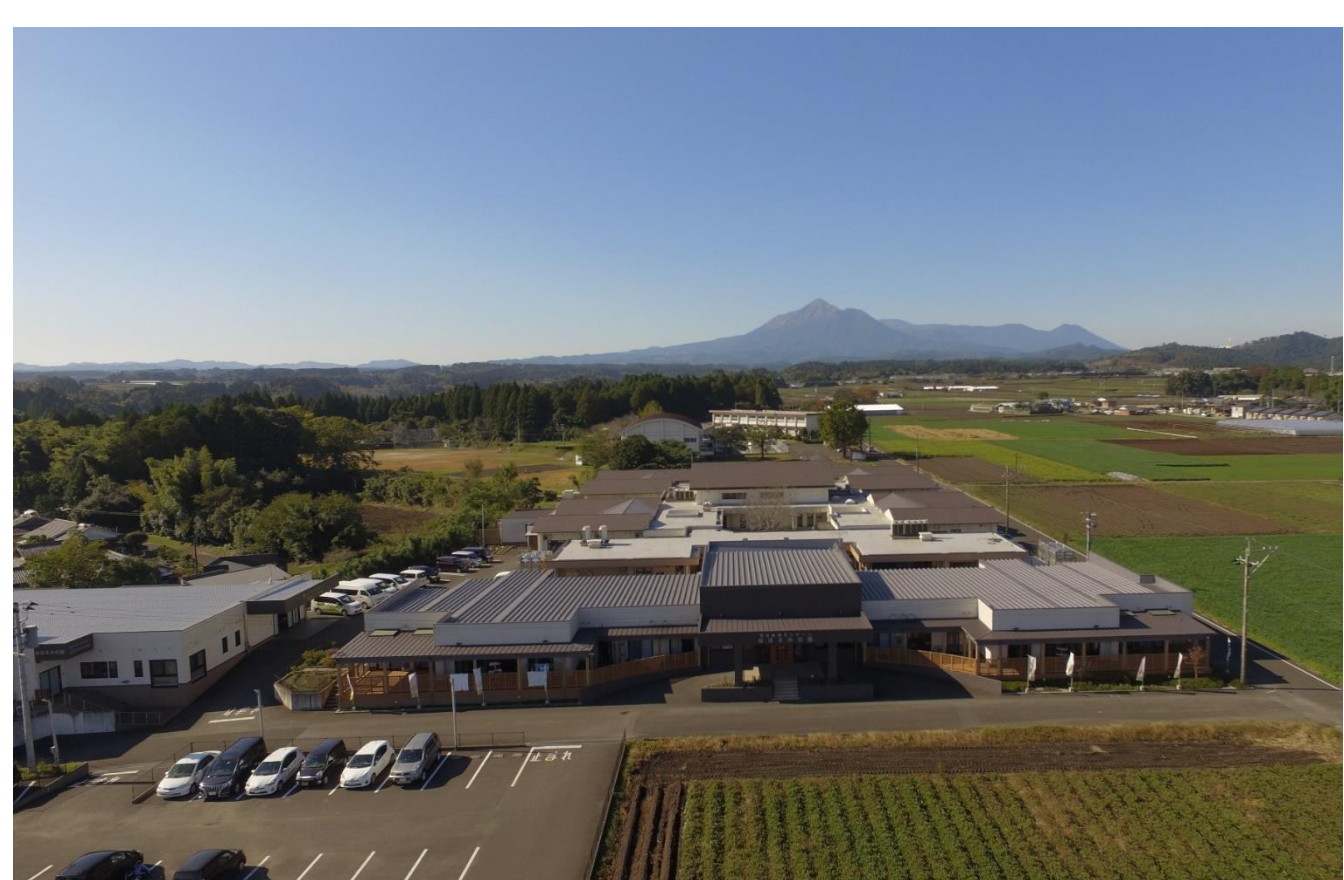
運営施設の1つ「特別養護老人ホームほほえみの園」の全景（バックは霧島山）