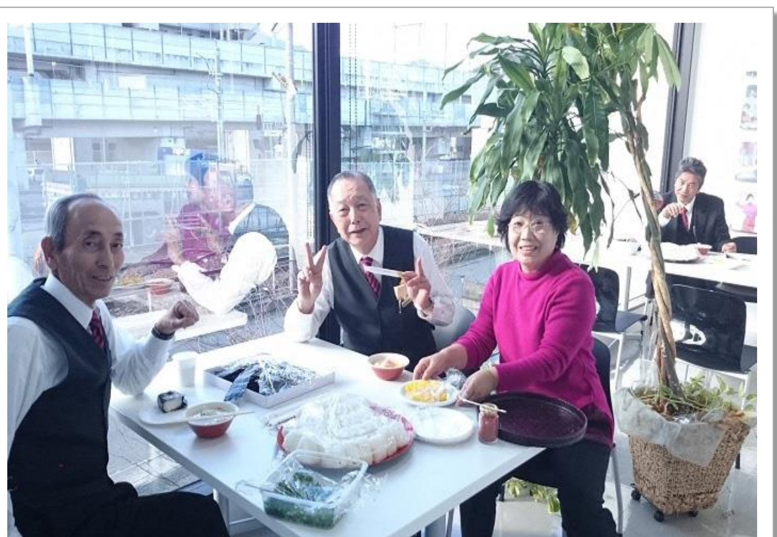
社内イベント：炊き出しの様子