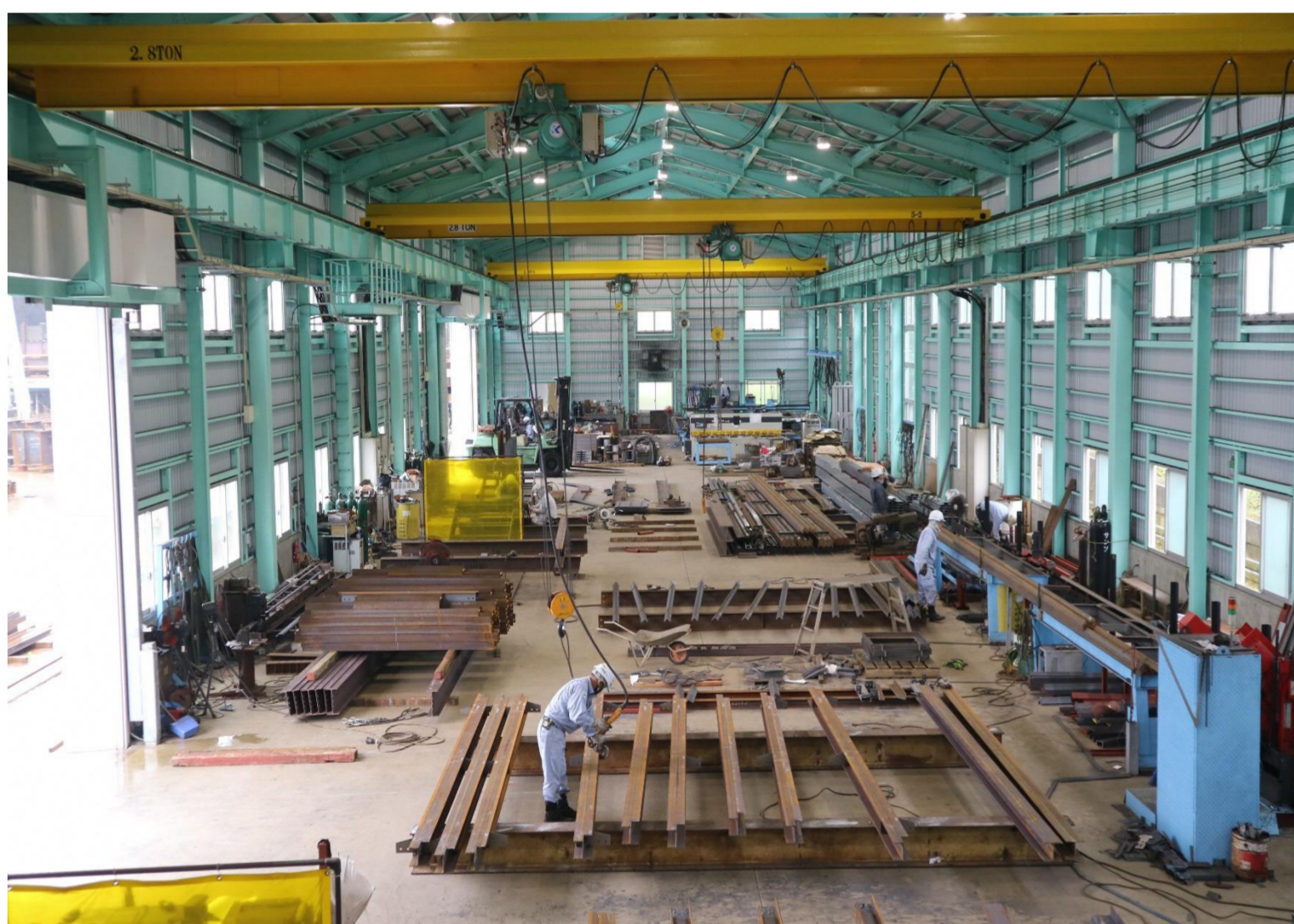
鋼構造物の制作を行っている自社工場