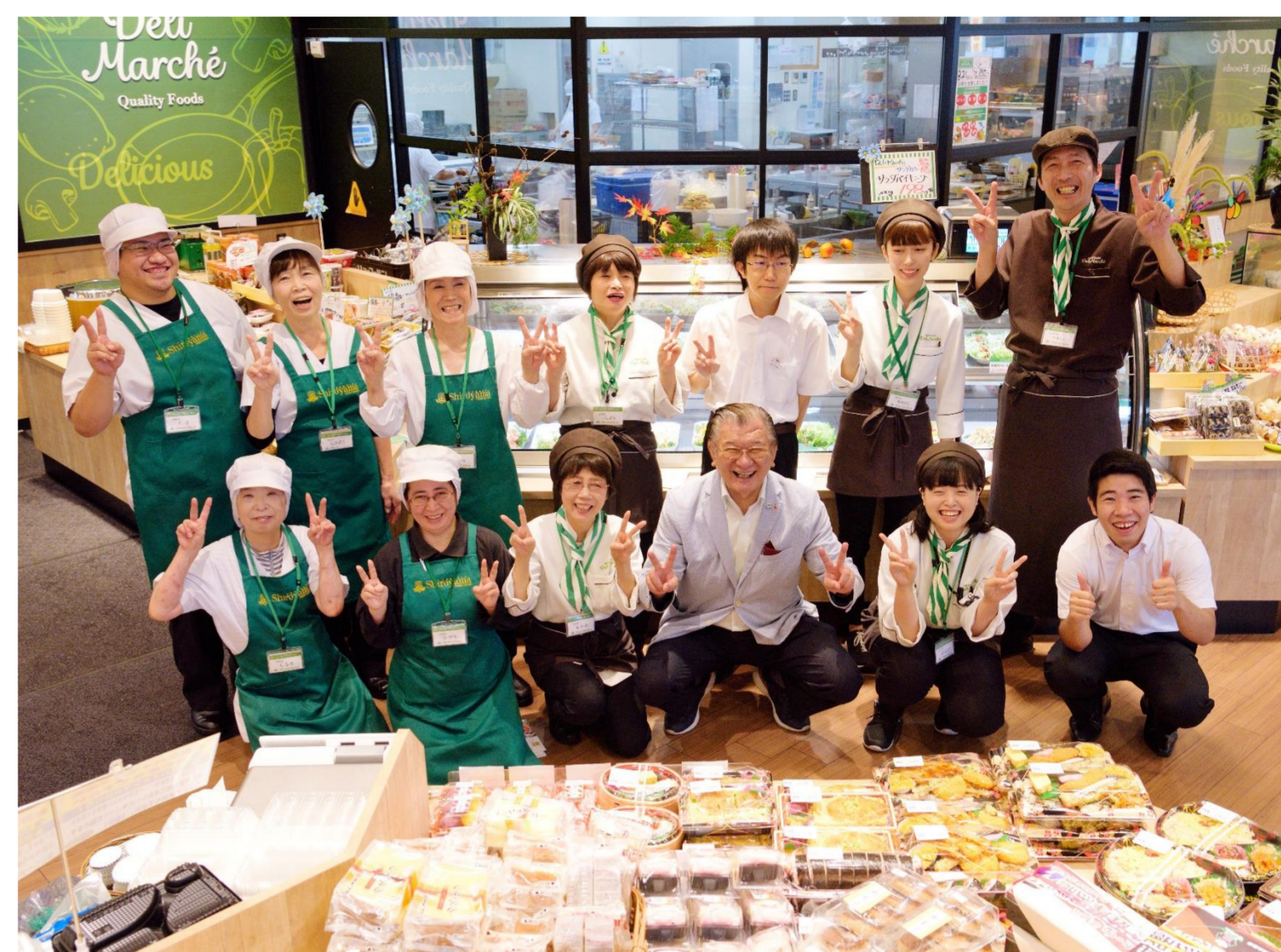
ベテラン従業員も活躍できる職場です

弊社は創業した1970年から地元鹿児島島の味、手作りの温かい味を追求してまいりました。手作りのぬくもりは素材の特徴についての知識や調理の洗練された技術から生まれます。お客様に喜んでいただける商品づくりを追求した結果、ベテラン従業員の豊富な知識や調理が貴重な武器として現在も引き継がれています。