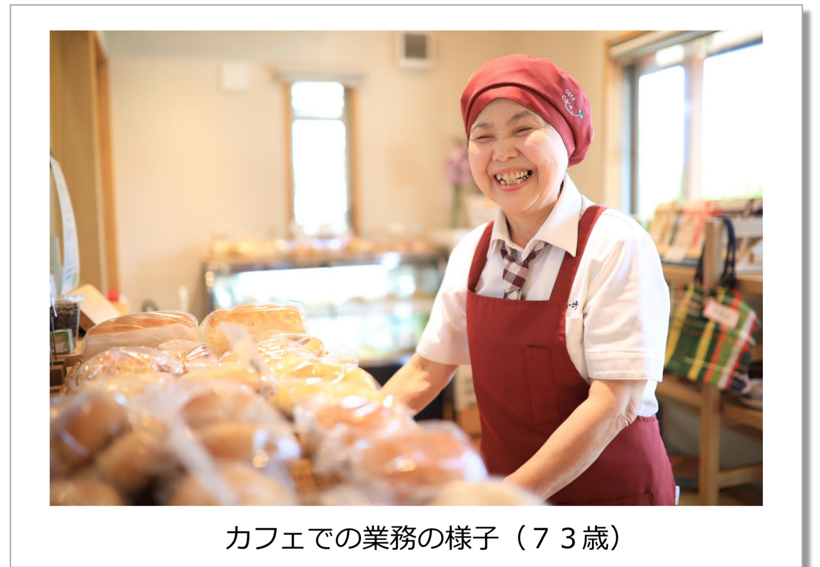
カフェでの業務の様子（73歳）

20代～70代までの人材が集い、年齢・性別を問わず、お互いに協力し合う風土。個々人のライフステージに合わせた働き方が出来る柔軟な職場です。