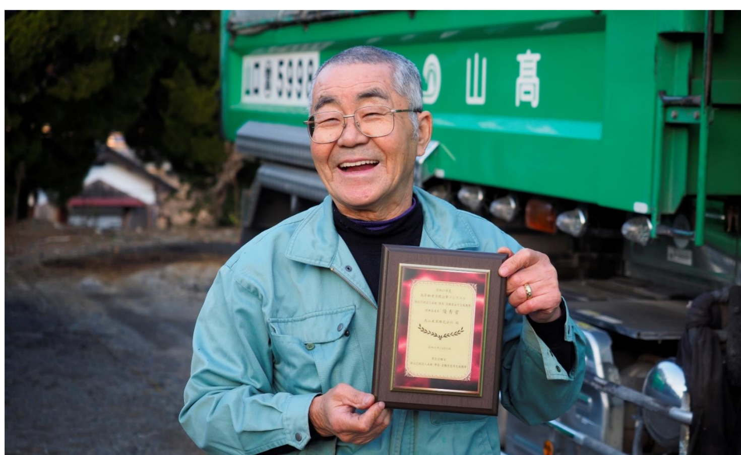
入社して50年、まだまだ現役！

私がここまで働き続けられたのは、会長の人柄と会社のおかげです。若いときは会社に迷惑をかけたこともありましたが、いろいろと助けてくれました。だから、会社のためにがんばろうと思いました。会社に感謝です！