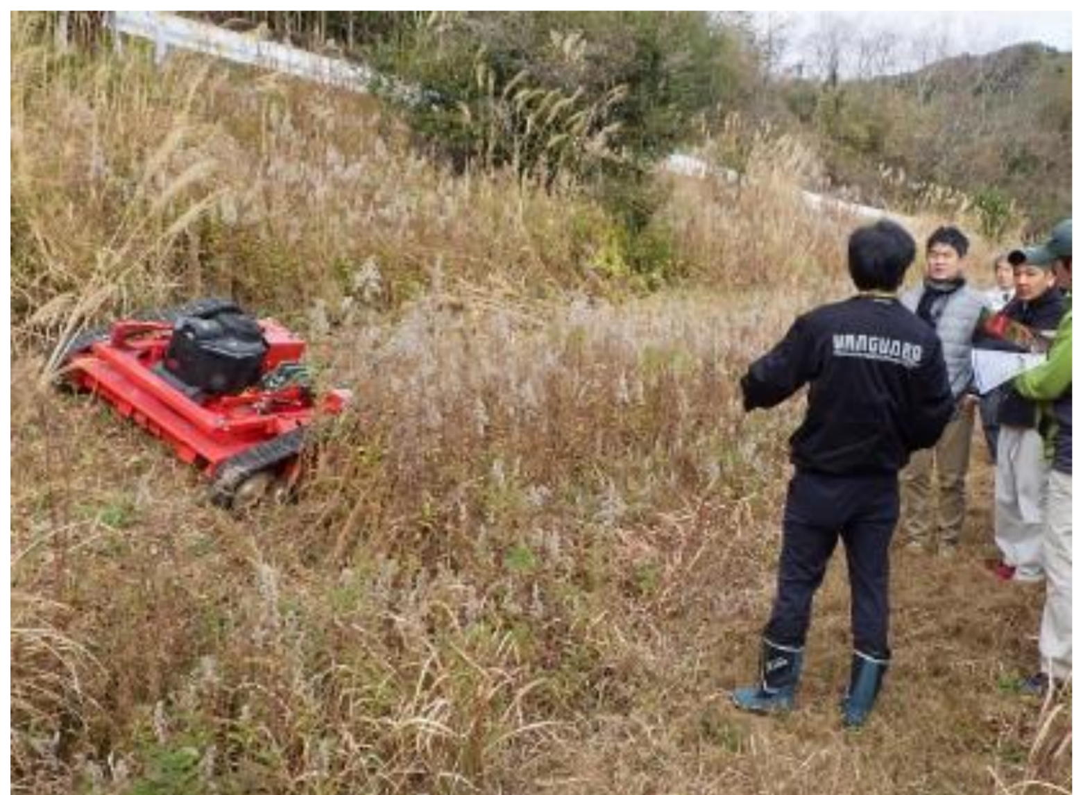
リモコン草刈機導入により身体的負担を軽減