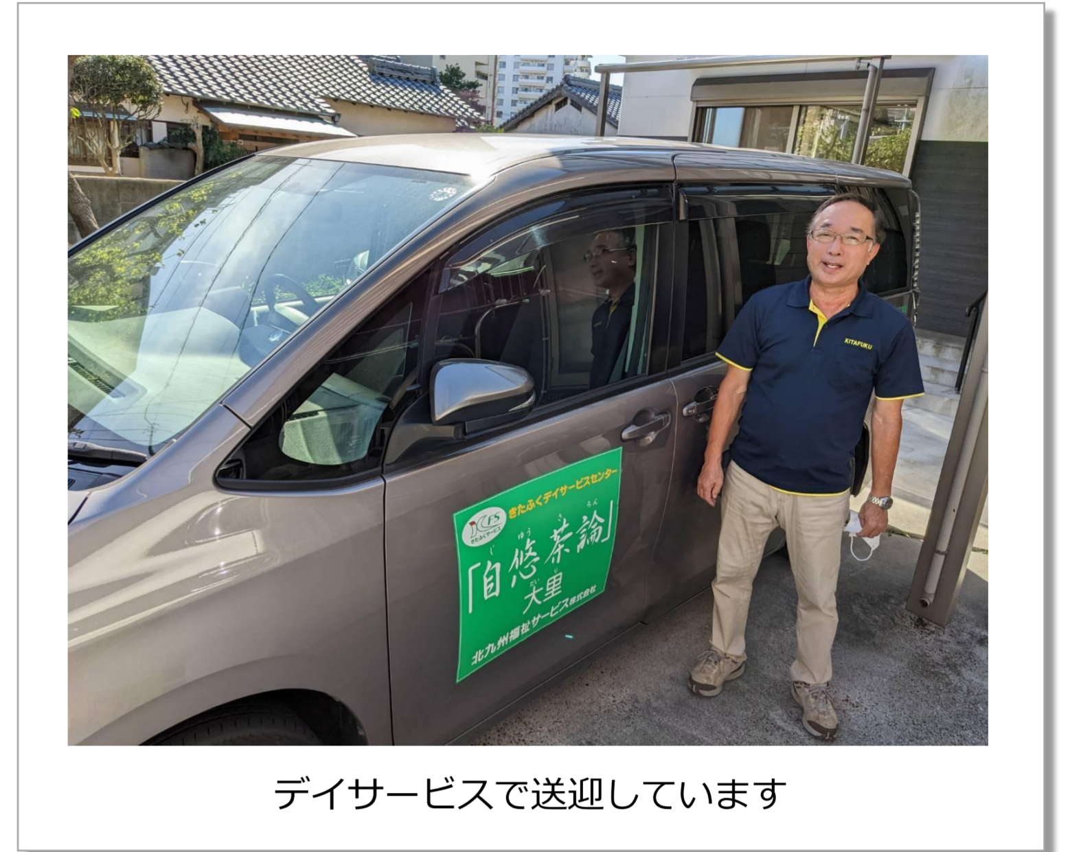
デイサービスで送迎しています

そのような中、弊社では高齢であっても元気に介護を続けている方が多くいます。これまで培った経験やスキルを活かしながら、個々人の希望に合わせて長く働き続けることのできる環境・制度づくりを目指しています。