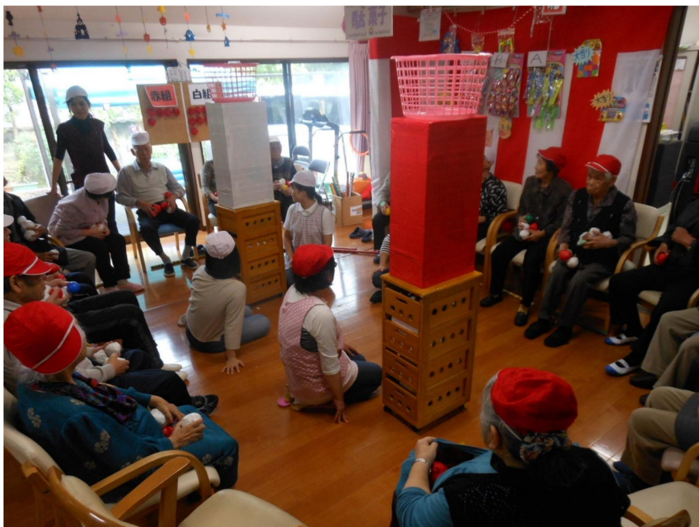
デイサービスの大運動会