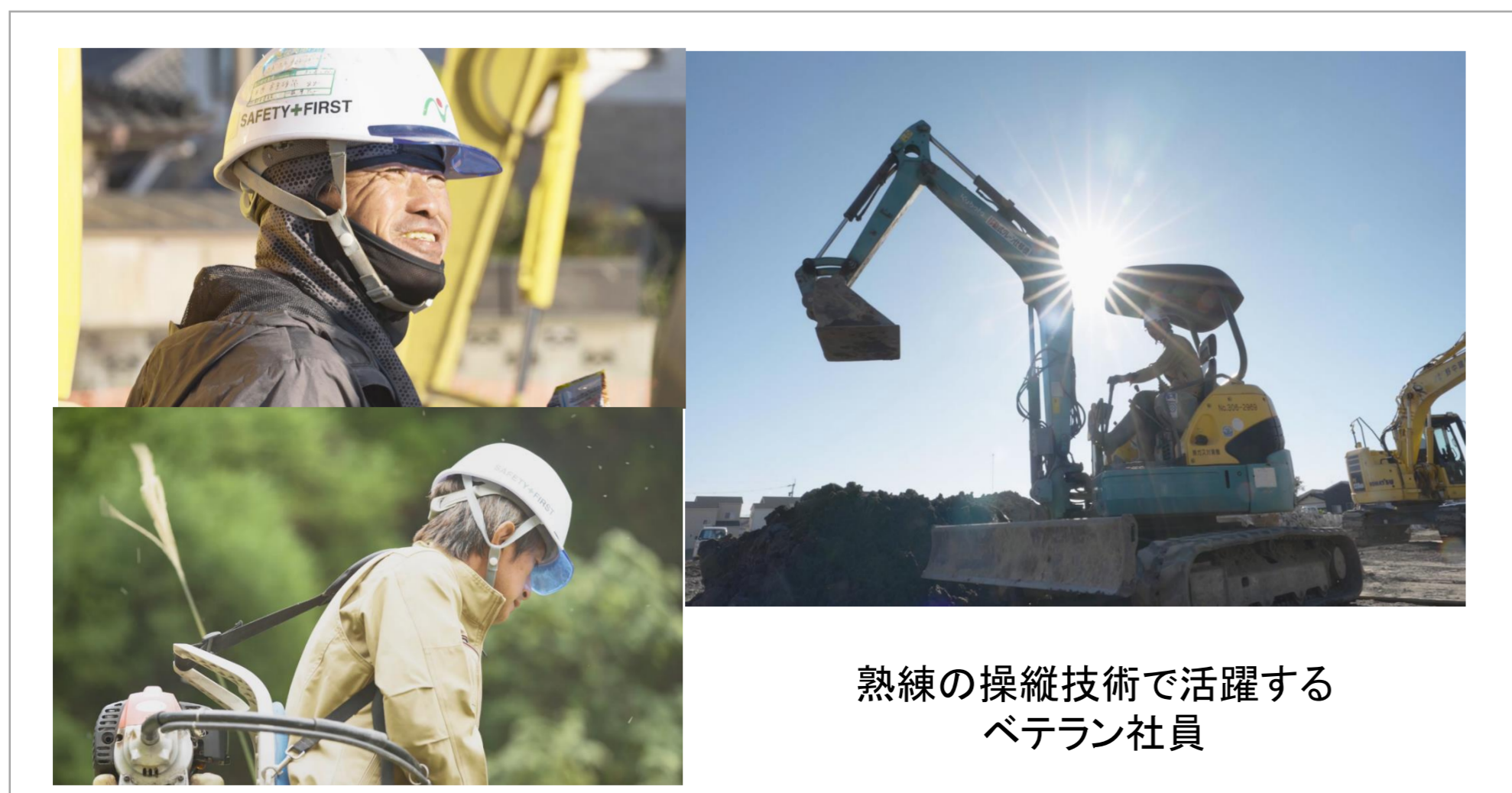
熟練の操縦技術で活躍するベテラン社員

一度病気のために野中建設を退職しましたが、回復後会社を訪ねたら「元気なら戻って来んね」と声をかけてもらいました。今では体調に合わせた勤務日数で、現場にも配慮してもらいながら勤めています。働いて体を動かすことが元気づくりでもあり、故郷への御恩返しだと思っています。これからも体と相談しながら働き続けたいと思います。