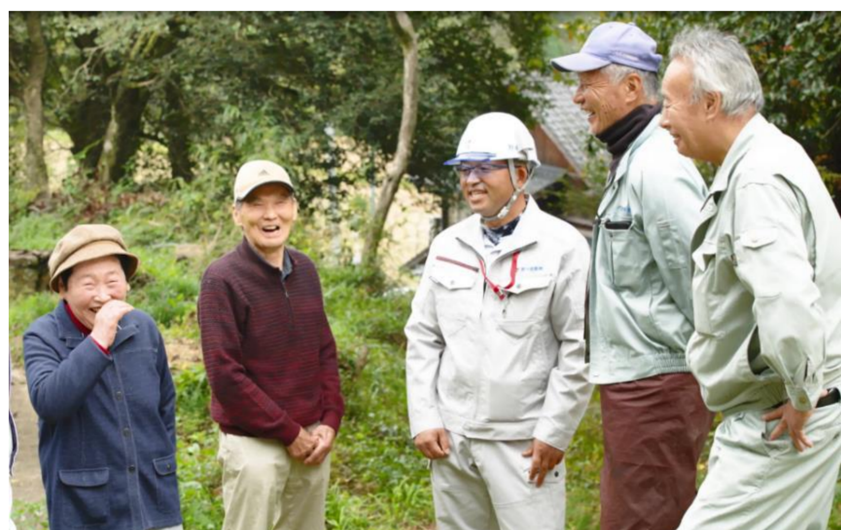
施主さんの喜ぶ顔が私たちのモチベーションです