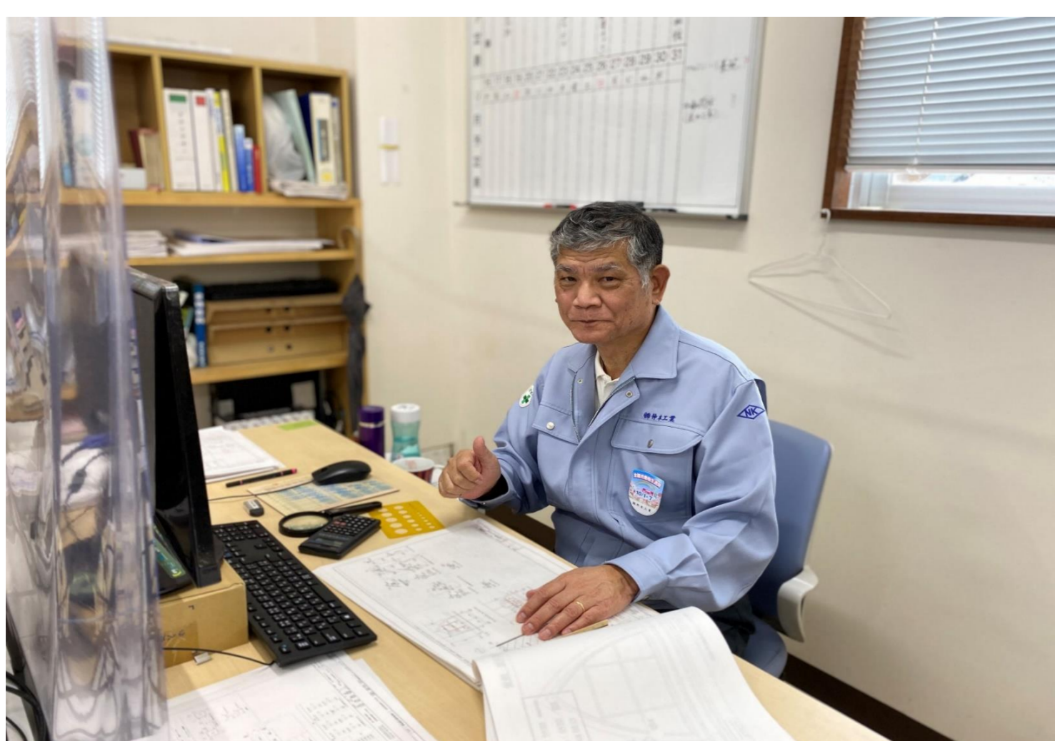
鉄骨工事の精算業務を担当しています

さまざまな業務に携わってきたので、これまでの経験が活かされるところにやりがいを感じます。鉄骨工事もそうですが、橋梁工事にも長く携わってきたので、そのノウハウもどんどん教えていこうと思っています。