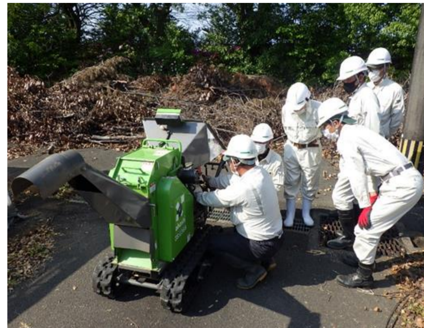
ベテラン職員から若手職員へ技能継承