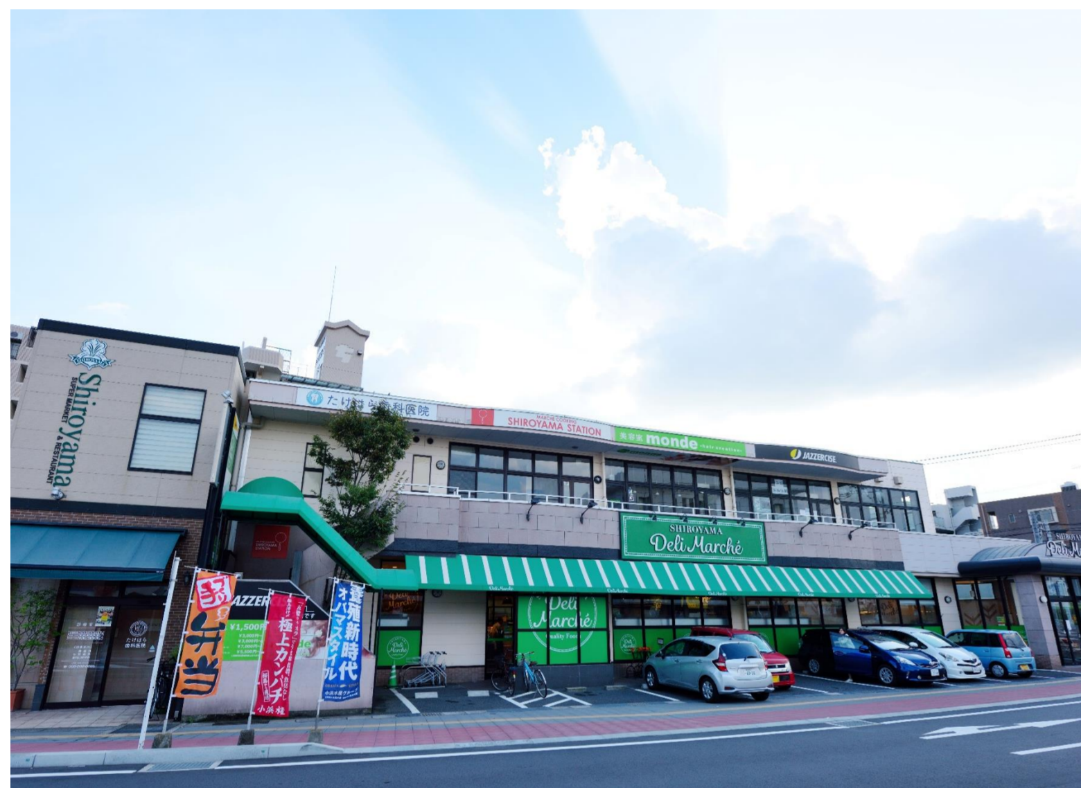
店舗外観（しろやまデリ・マルシェ）