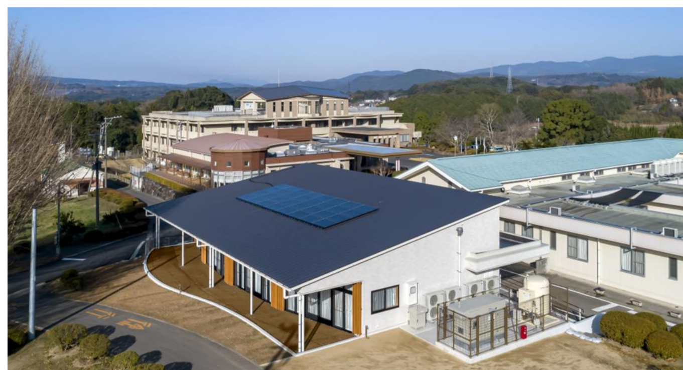
杵築市内 運営施設