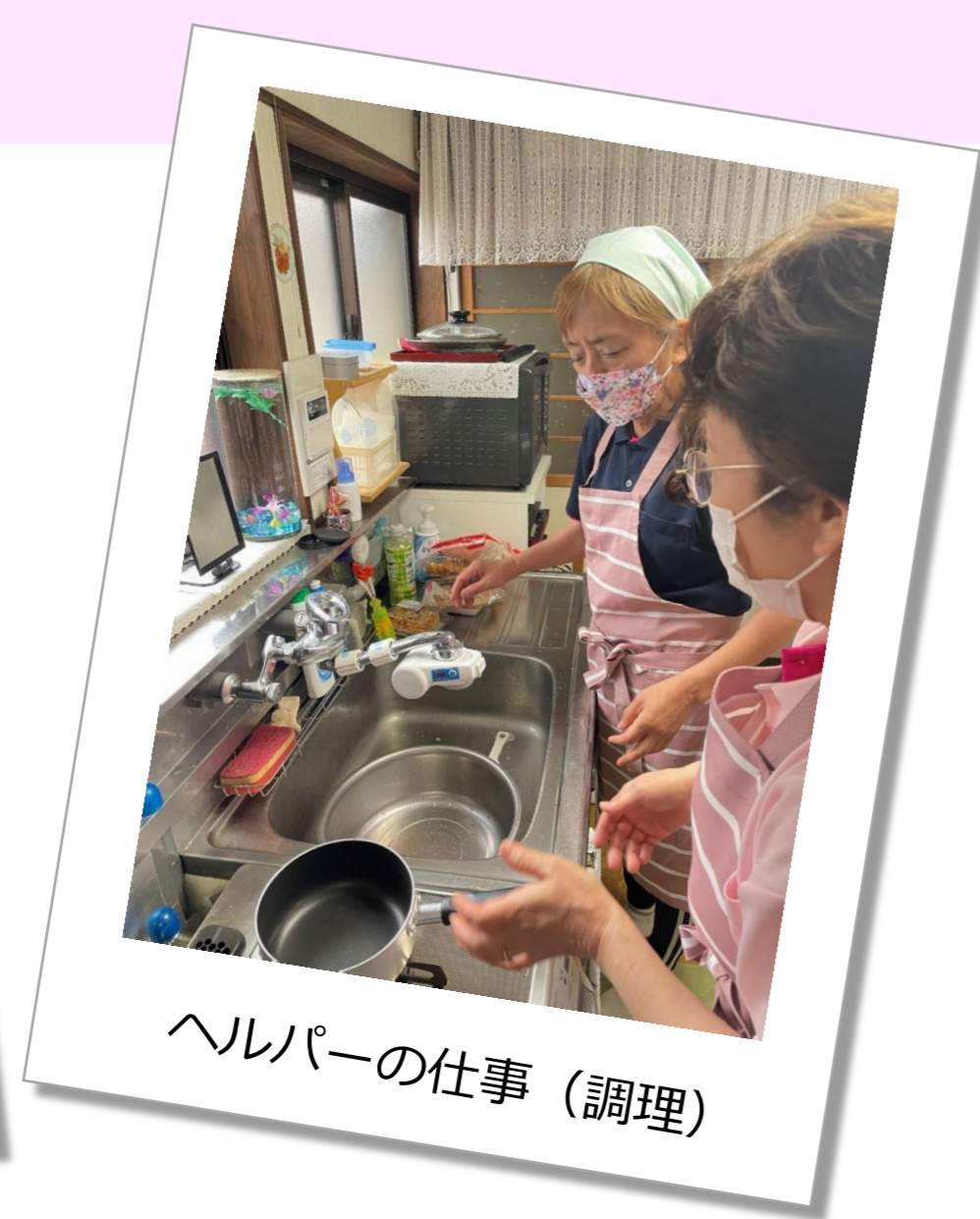
ヘルパーの仕事（調理）