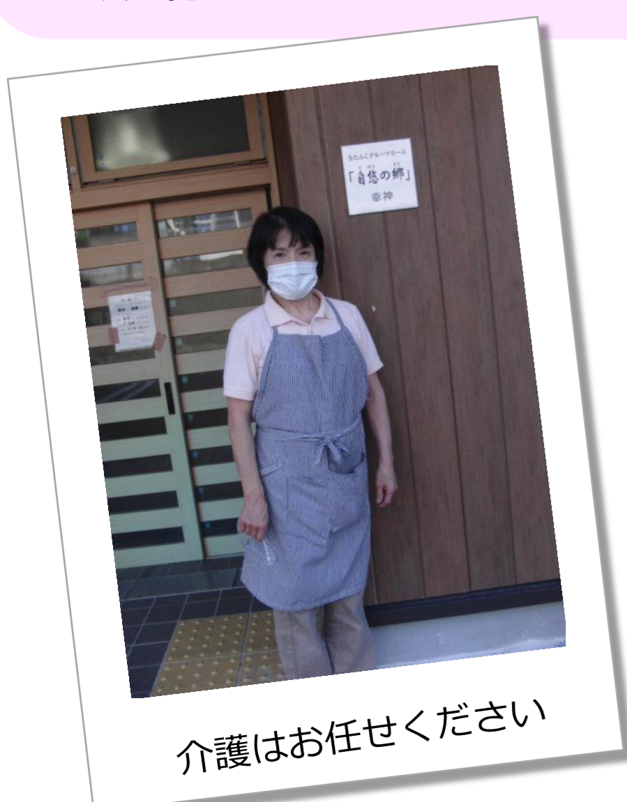
介護はお任せください