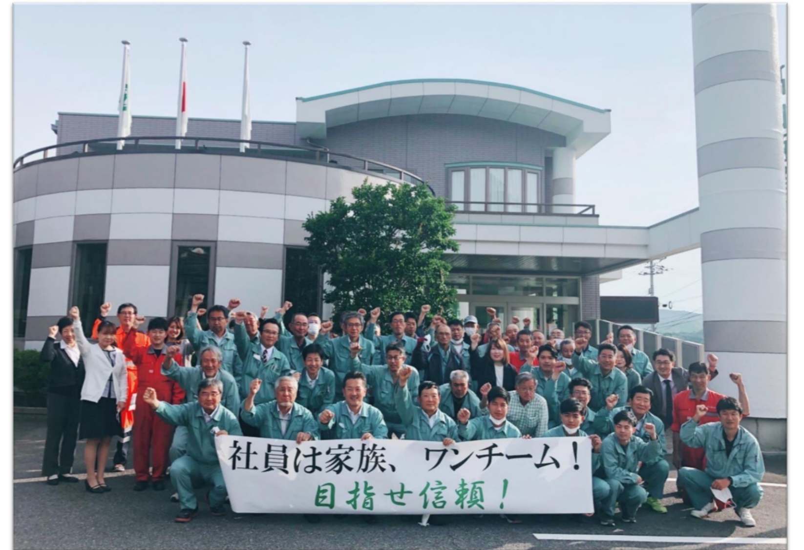
新事業年度 会社スローガン発表

1954年に創業し68年を経た当社は、次の100年を目指す上で、経験豊富な人材の確保と、企業の財産である高齢者により培われてきた技術力や知識を若手社員へ伝承するため、定年の引上げ等を行うこととしました。