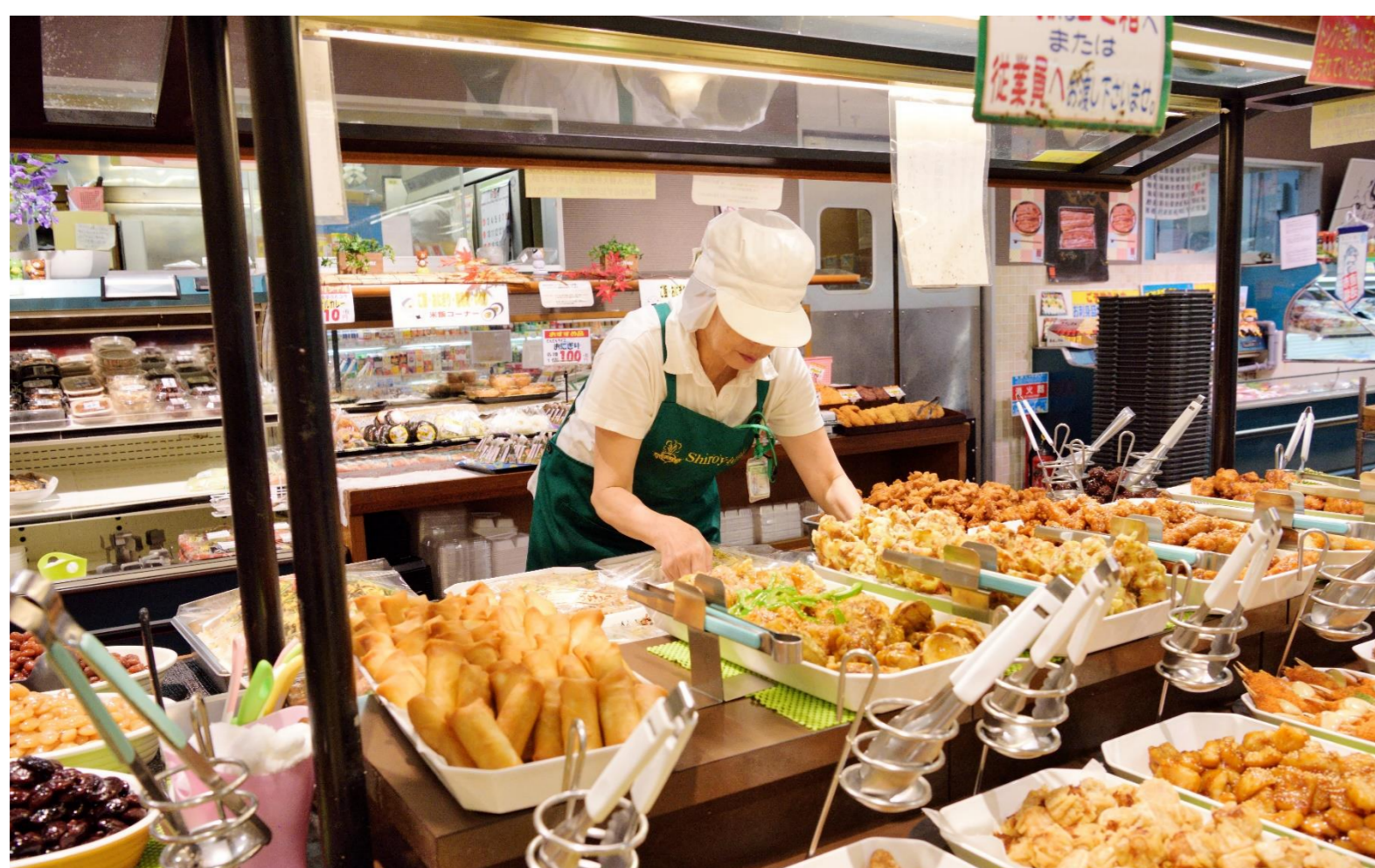
惣菜の品出しを行うベテラン従業員

長く、のびのびと楽しく勤務させていただいております。人は働くことに生きがいを感じ、働くことによって幸せを感じることができると思っています。体は年々衰えていきますが、気持ちが続き、会社が必要としてくれる間は進んでなんでもしたいと思っています。これからもお客様に喜んでもらえるように頑張ります！！