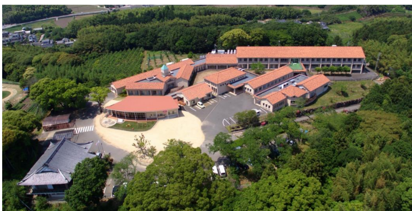
日出町内 運営施設