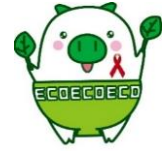
福岡県マスコットキャラクター エコトン