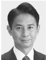
たに 谷 あい 正明 現3 元農林水産副大臣。党参議院幹事長。京都大学大学院修士課程修了。49歳。