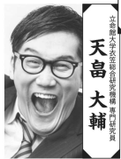
天島大輔 特定枠 立憲民主党比例代表選挙区選挙区支部長