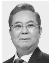
よこやま 信一 現2 前復興副大臣。北海道大学大学院博士課程単位取得、水産学博士、62歳。

公明党はこの7人をはじめ参院選比例区に17人を公認しています。 ※年齢は選挙当日現在