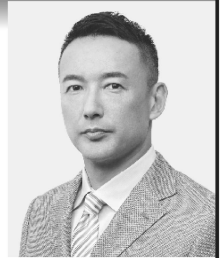
れいわ新進組 代表