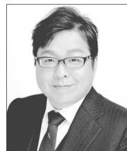
さくらい まこと 党首 桜井 誠