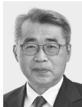
みやざき 宮崎 まさる 現1 前環境大臣政務官。党環境部会長。埼玉大学工学部卒。64歳。