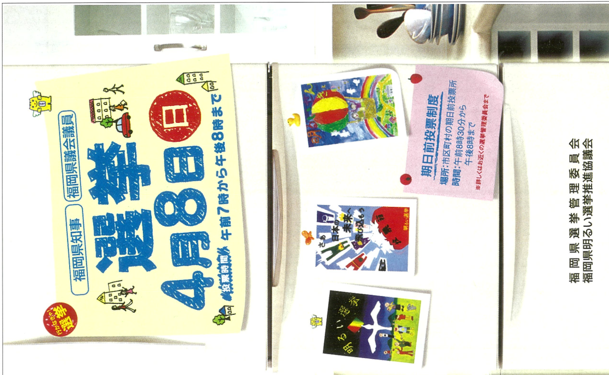
福岡県選挙管理委員会 福岡県明るい選挙推進協議会