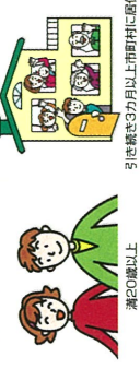
満20歳以上 引越先が3か月以上市区町村に居住

A 日本国籍は、20歳以上、選挙権を得ますが、知事や市区町村長、県や市区町村の議会議員の選挙の場合には、任期が20歳以上であること、住みに、引越先が自国以上、その市区町村に住んでいることが必要となります。また、選挙権があっても選挙人名簿に登録されていない人は、投票することができません。