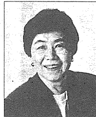
社民党 党首 土井 たか子