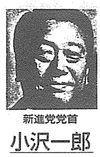
新進党党首 小沢 一郎