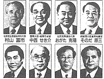
社民党 候補者名簿