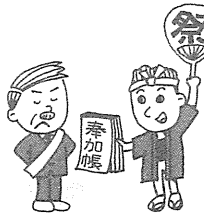
お祭などの寄付・お酒など