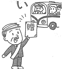
団体旅行の寄付や差し入れ