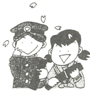
入学、卒業、就職、出産などのお祝い