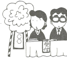
葬式や開店祝いの花輪など