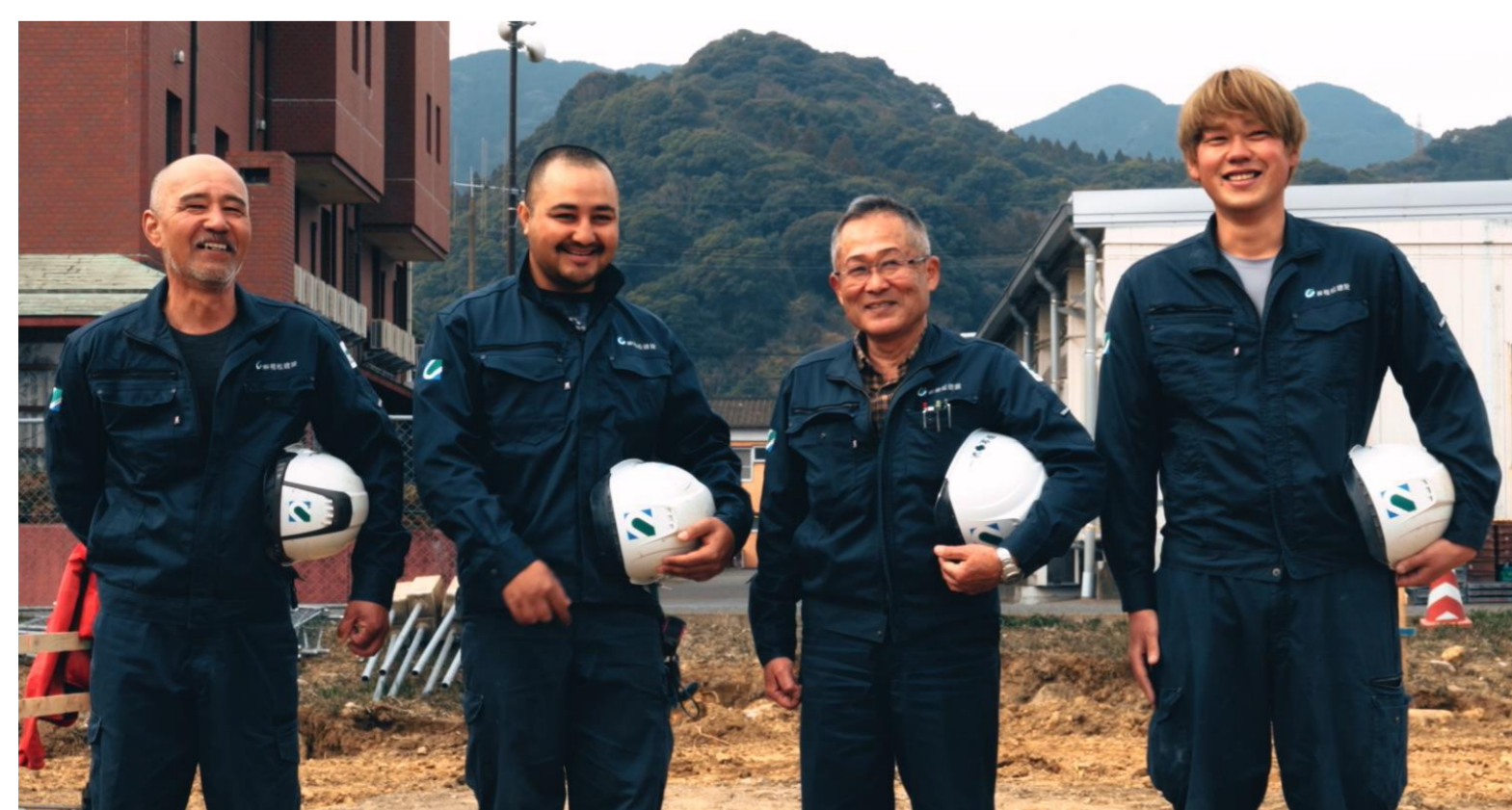
みんなが働きやすい職場環境づくりを目指しています