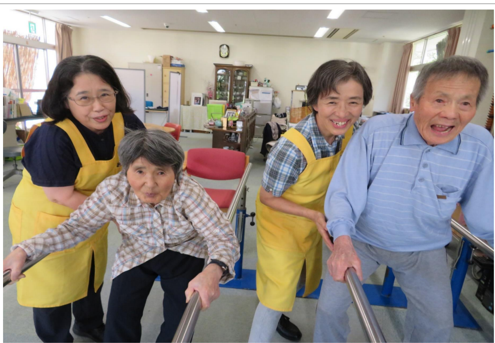
歩行訓練、がんばってます!!