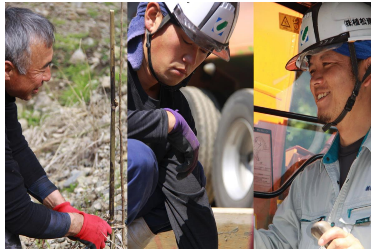
現場で活躍する社員

当社では、令和4年度より定年制を撤廃し、社員37人のうち11人が60歳以上のベテランとして活躍しています。「地域に愛される会社でありたい」、「関わる全ての人々が互いにより良くなっていくような会社でありたい」という願いを持っています。その願いを実現するためにも、共に働くスタッフを大事にすることが重要なことと捉えています。