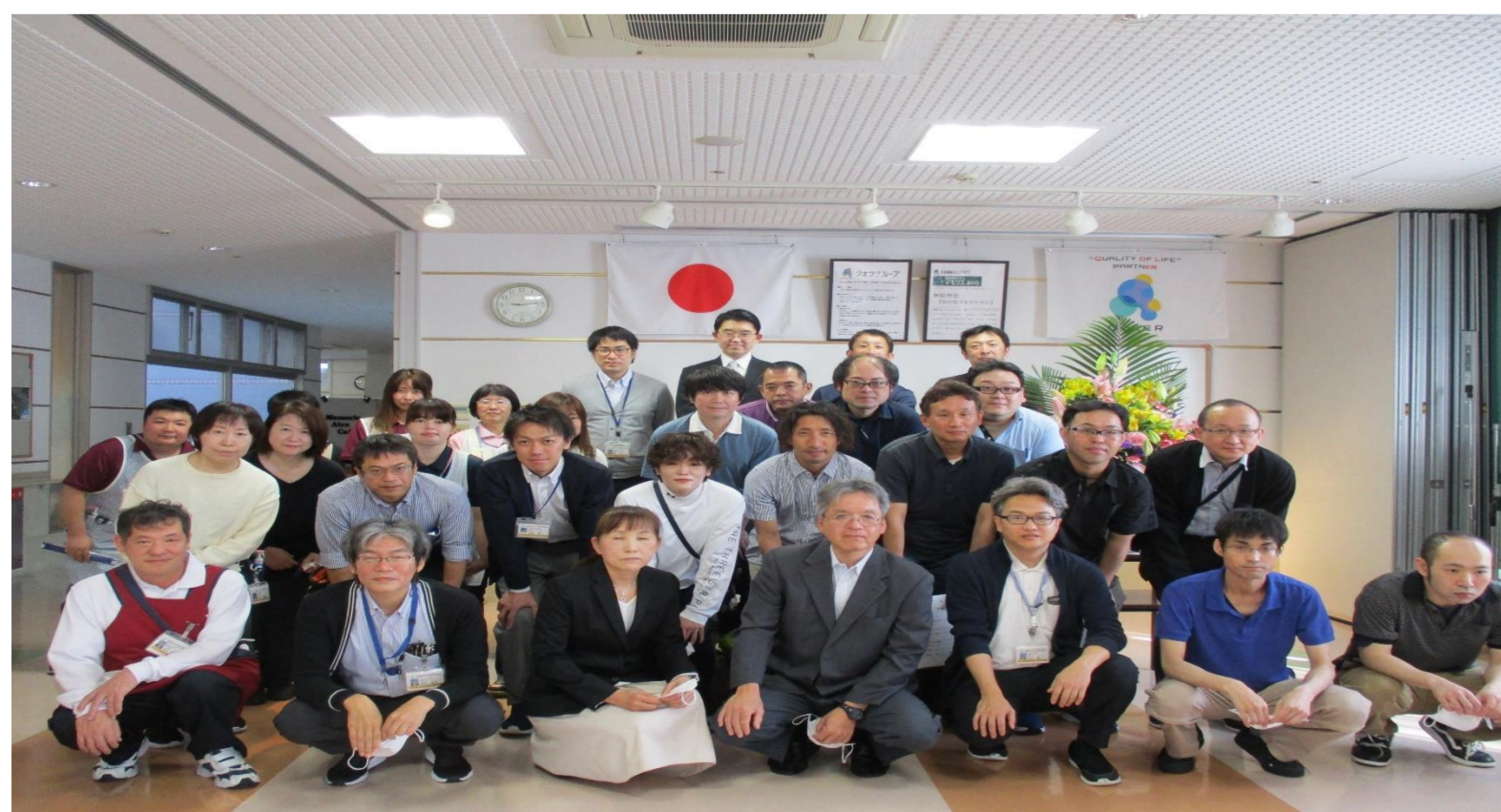
年齢・性別を問わず誰もが楽しく働ける職場です。