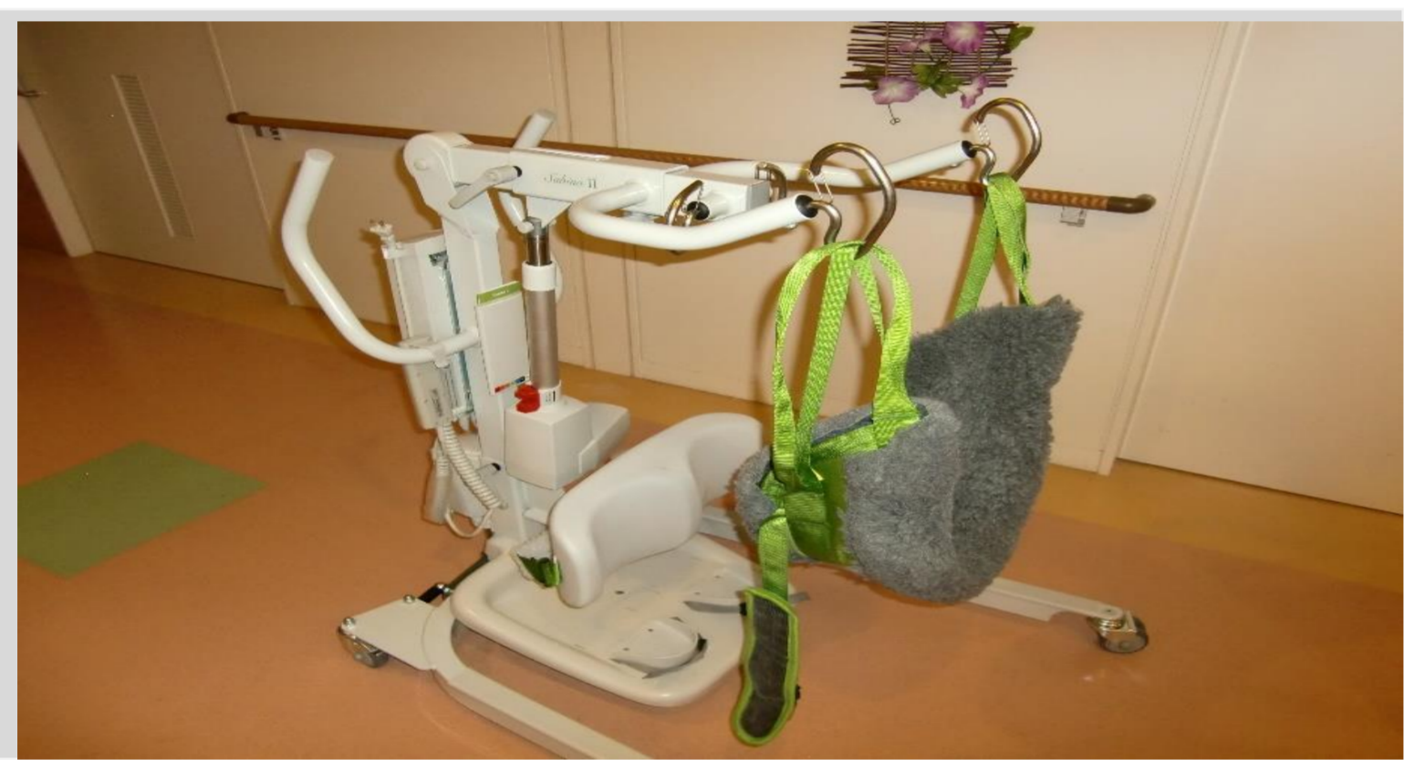
様々なタイプの機器を導入し、職員の負担を減らしています。