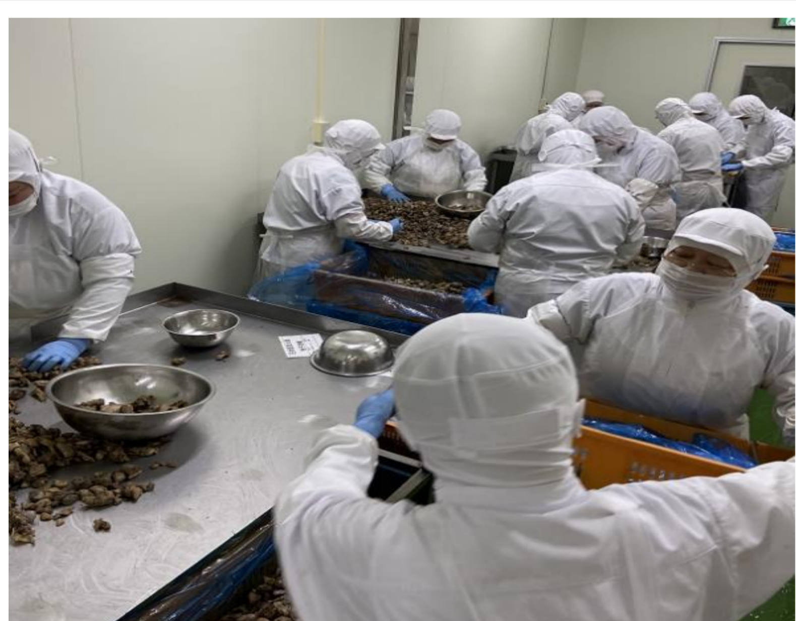
高さ調節可能な作業台