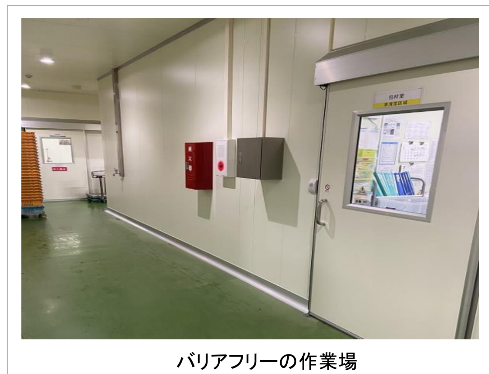
バリアフリーの作業場

若年層が町から流出し、65歳以上の高齢者人口が1/4を超える中、高齢者は貴重な労働力であることや、食品製造メーカーである当社は、家庭で長年料理をしてきた高齢女性の料理の腕や段取りの良さが生かせる職場であることから、地元企業を定年退職した高齢女性に声をかけ、従業員4人で始めたのが会社の始まりです。