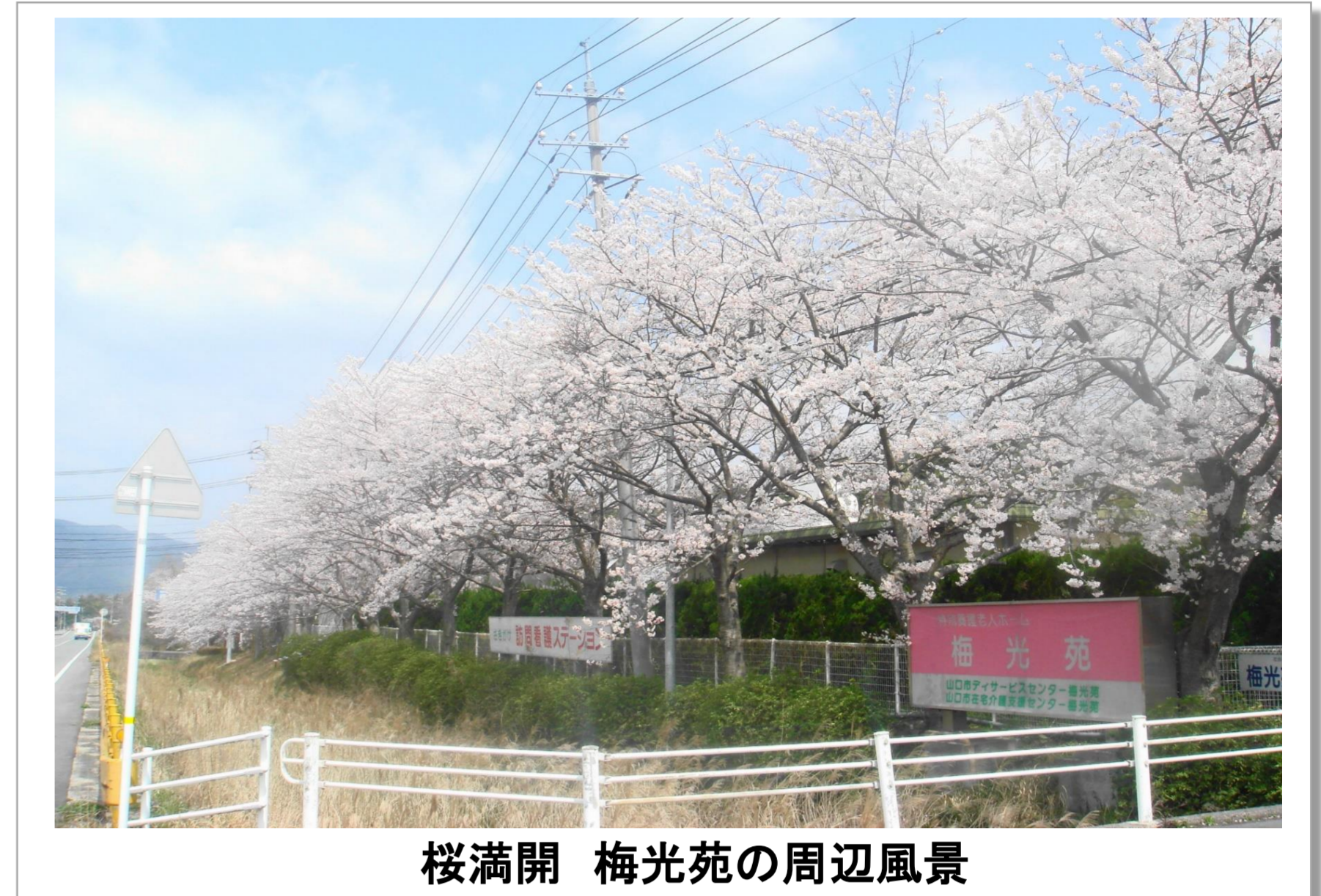
桜満開 梅光苑の周辺風景

少子・高齢化の進展により、介護業界においても人材不足が深刻な問題となっています。そんな中、知識・経験・スキルが豊富な高齢者は貴重な戦力であり、経験の少ない職員への生きた「お手本」でもあります。また、若者や新規採用者の確保が難しくなっていることから、高齢者の方々には、健康で生き生きと働いていただきたいと考えています。