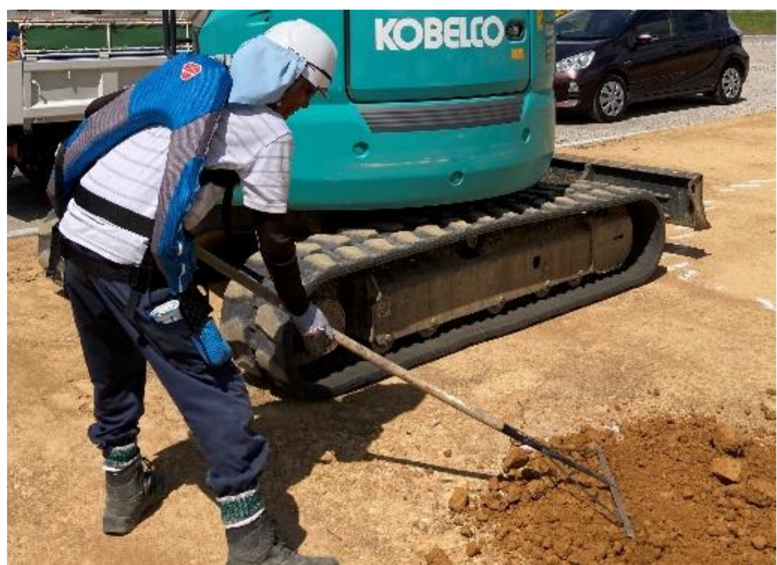
アシストスーツを着用しての業務風景