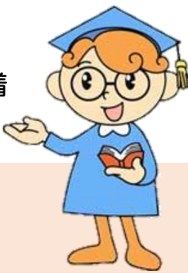
ヒューマン博士 （福岡県の人権啓発キャラクター）

主催/福岡県、(公財)福岡県人権啓発情報センター ■問い合わせ先/福岡県福祉労働部人権・同和対策局調整課 TEL:092-643-3325 FAX:092-643-3326 Email:chosei@pref.fukuoka.lg.jp