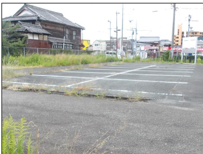
敷地内の L 形側溝