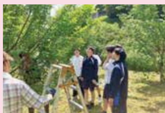
太宰府の梅を収穫

太宰府天満宮近くのカフェの協力で新メニューを考えたり、梅ジュースを作っている企業とラベルのデザインを考えたりしました。実際に梅の実の収穫もお手伝いし、現在、この梅ジュースを太宰府市のふるさと納税返礼品にすることを目指して活動中です。この他にも太宰府市の観光マップを作成するグループや太宰府市民の健康を促進するイベントを考えているグループ、太宰府市の森に生息する昆虫を調べることを通して環境問題に取り組んでいるグループなど17の地域の団体や企業、太宰府市役所、近隣大学とともに、太宰府市の活性化のために日々探究活動に励んでいます。