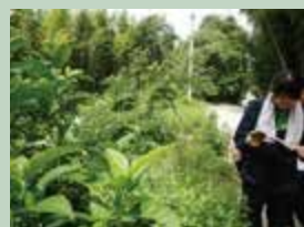
図鑑を見ながら樹種の探索

これらの活動から、飯江川には魚道が適切に整備されていない可動堰が多いことが分かりました。その可動堰を整備することを目的として飯江川上流域で拡大を続ける竹林を伐採し、土壌の吸水力を向上させる森づくりを行っています。