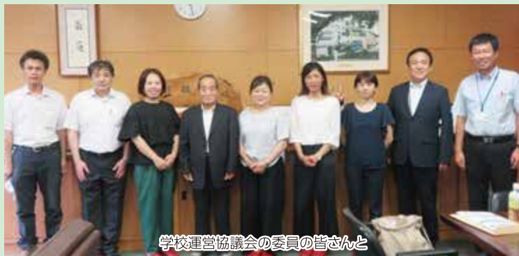
学校運営協議会の委員の皆さんと

第1回では学校運営方針の承認、授業見学をしていただきました。第2回では校則の見直しについて協議を行い、第3回では本年度の取組について総括し、次年度に向けて議論を深めます。