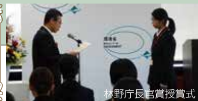
林野庁長官賞授賞式