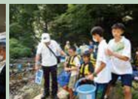
生き物観察会ボランティア