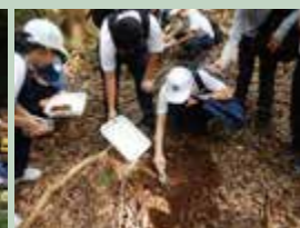
土壌調査の様子(清水山)