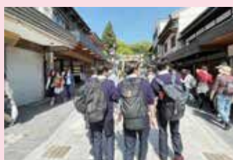
観光マップ作成のためのフィールドワーク