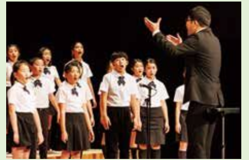
ステージ発表の様子

県HPには、オープニングセレモニーや記念式典、記念講演など、記念行事の様子を写真で紹介しています。ぜひ、ご覧ください。