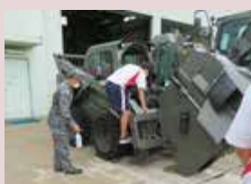
築城航空自衛隊でのインターンシップ