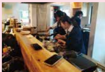
梅を使った新メニューを考案