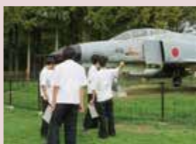
メタセの杜でのフィールドワーク