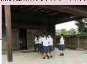
旧蔵内邸への調査