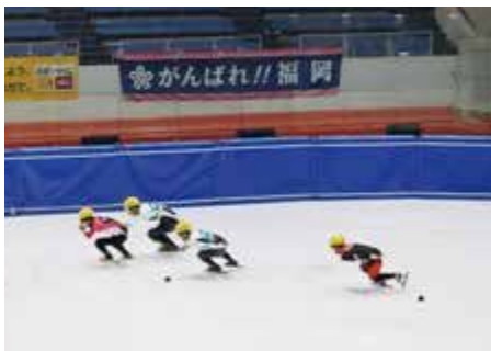
ショートトラックの様子