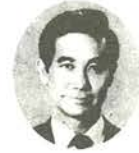
衆議院議員候補者