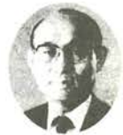
衆議院議員候補者 公明党公認