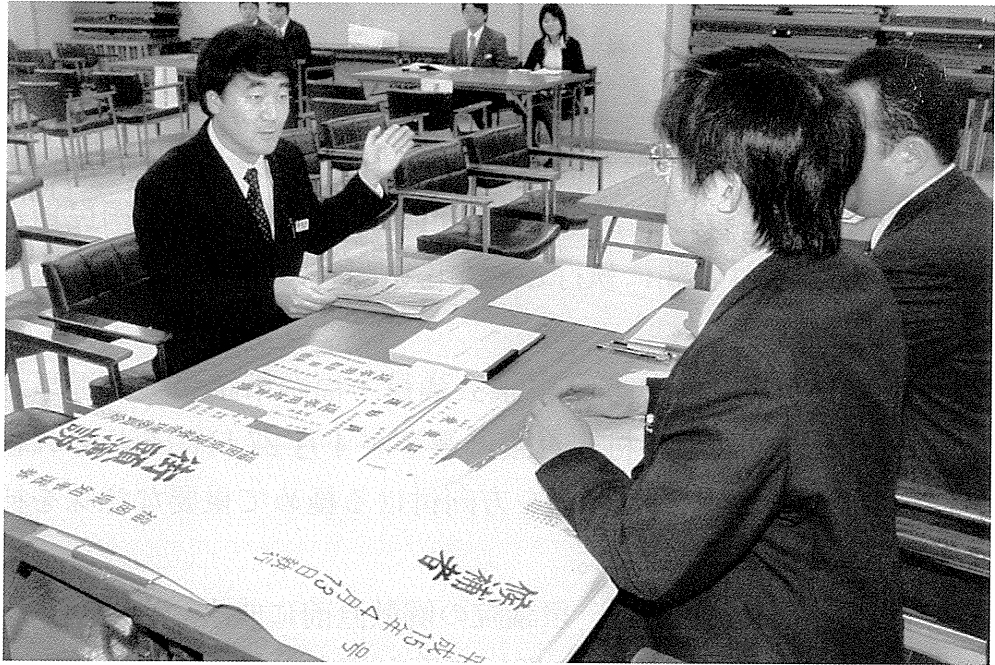
県知事選挙立候補受付リハーサル風景 【平成15年3月27日朝刊】