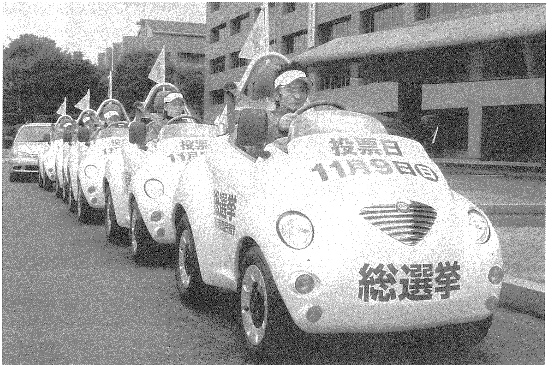
衆議院議員総選挙 選挙啓発風景 【平成 15 年 11 月 1 日夕刊】