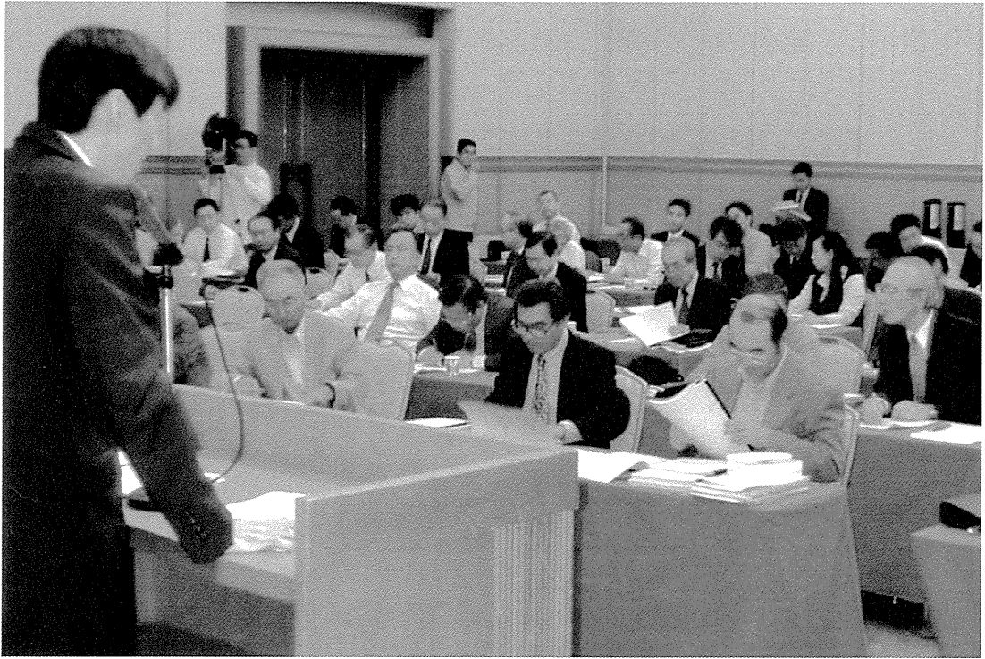
衆議院議員総選挙立候補予定者説明会風景 【平成 15 年 10 月 15 日朝刊】