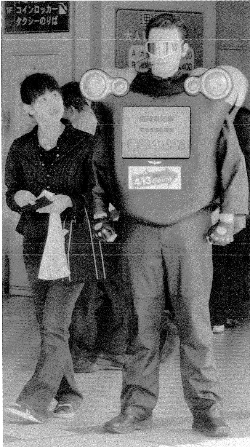
県知事・県議選挙 選挙啓発風景 【平成15年4月5日朝刊】