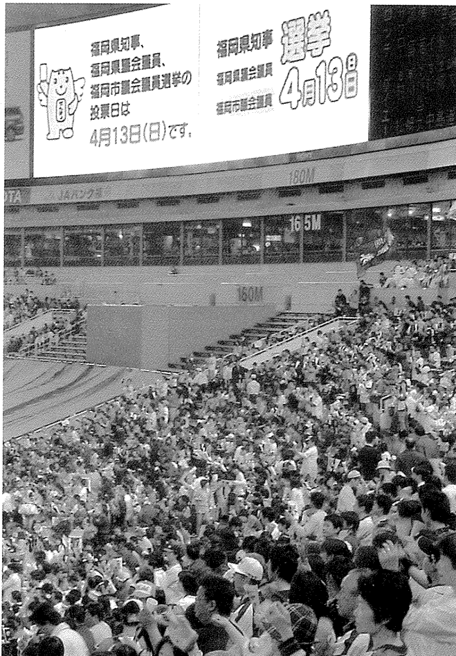
県知事・県議・福岡市議選挙 選挙啓発風景 【平成15年3月31日朝刊】