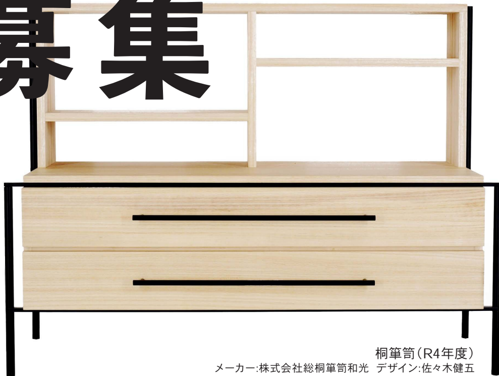
桐筆筒 (R4年度) メーカー:株式会社総桐筆筒和光 デザイン:佐々木健五