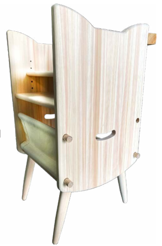
猫イス (R4年度) メーカー:株式会社馬場木工 デザイン:松本意匠