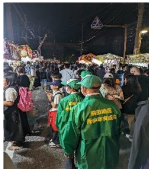
祭り特別パトロール

これも偏に先輩、地域、学校、PTA等の協力の賜物であり、子どもファーストかつ多世代交流を充実し、常にアップデートを重ね次の世代へ襷を繋いでいく。