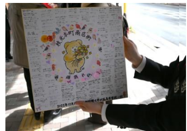
枝光本町商店街に送った 寄せ書き