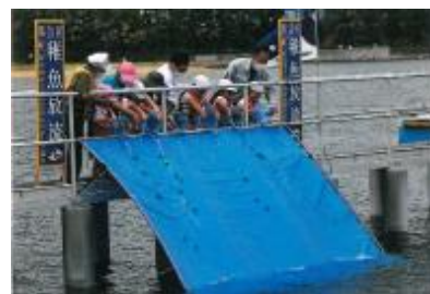
メバル稚魚放流活動