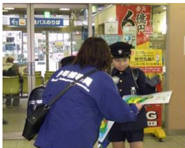
小学校近辺の駅における 見守り活動

この度は、「福岡県青少年健全育成アワード2023」という栄えある賞を賜り、大変光栄に思う。久留米警察署少年補導員連絡会は、発足以来、関係団体等と協力しながら少年の健全育成のために街頭補導、見守り活動などを継続して行ってきた。今回の受賞を励みに、より一層、少年の健全育成活動に邁進して参りたいと考えている。