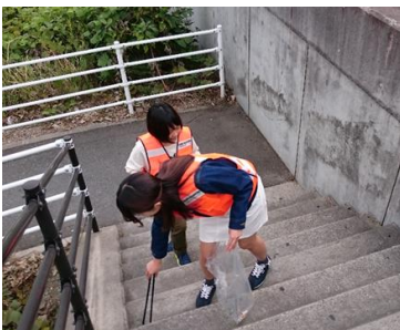
大学周辺の清掃活動

この度は、このような栄誉ある賞を賜ることができ大変光栄である。当団体は地域防犯組合や福岡県警のご協力のもと活動を行っており、今回の受賞は私達だけの力ではなく常日頃より支えてくださる方々のお陰である。今後は、防犯活動を通して更に大学周辺地域の方々との交流活動を増やし、学生も地域住民の方も安心して暮らせる街づくりに貢献していきたい。