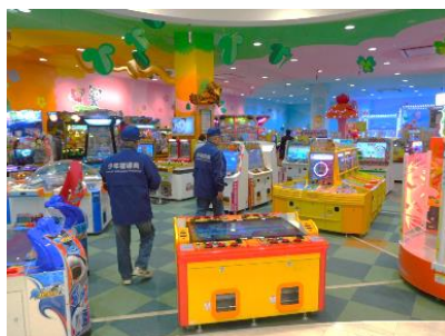
ゲームセンターへの立ち入り