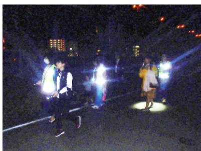
夜間街頭補導活動

この度は、私ども連絡会の活動が「福岡県青少年健全育成アワード」という名誉ある賞を頂戴し、誠に光栄に思う。少年を取り巻く環境は日々変化していることから、今後も情勢の変化に目を向けながら「少年を犯罪に加担させない、犯罪被害から守る」活動を目指し、少年補導員一丸となって励んで参りたいと考えている。