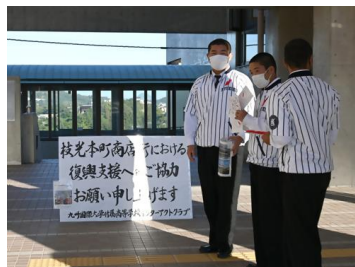
枝光本町商店街の火災に対する復興支援募金活動