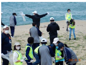
校区内の清掃活動