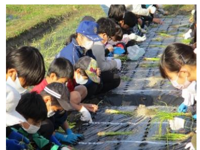
小学生に対する農業体験活動