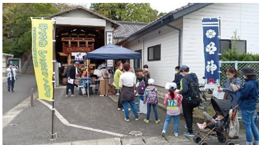
子どもフェスティバル

平成11年からの活動が思い起こされた日となり、県知事のお言葉や表彰状を頂き感激した。同時に、子ども達の健全育成事業や地域の活性化に育もうという思いが募った。仲間の力を借りながら、楽しくチャレンジ精神をもって頑張っていきたい。また、これらが継続していくように努めたいと思う。