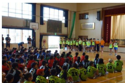
小学生ドッジボール大会

私たち板付校区ジュニアリーダーは、上級生の背中を見て活動し、そして次の世代の上級生となって活動することで長年継続してきた。活動を始めるときは皆、自分たちにできるのか不安であるが、仲間と協力し、私でよければの思いで活動することで、参加者が笑顔で喜んでくれることに達成感を感じている。これからも後輩につながっていけるよう、活動を続けていきたい。