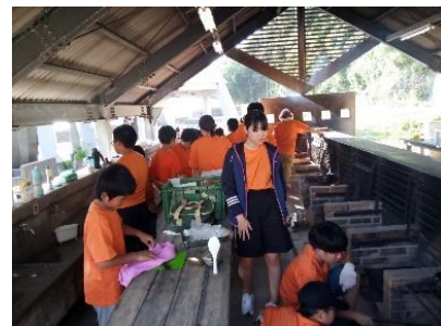
チャレンジデイキャンプ