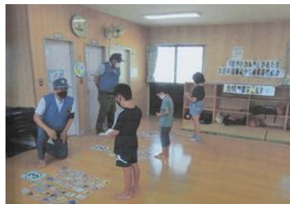
健やかカルタ大会