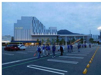
大型商業施設周辺における 街頭補導活動

福岡県各地区で、地域に根付いた様々な活動を続けておられる団体の皆様と一緒に受賞できたこと、大変嬉しく思う。先輩から受け継ぎ実施している各種活動を今後も継続する上で本賞の受賞は会員一同の大きな支えとなった。これからも「非行を生まない社会づくり」を目標に微力ながら青少年の非行防止並びに健全育成活動に尽力して参りたいと考えている。