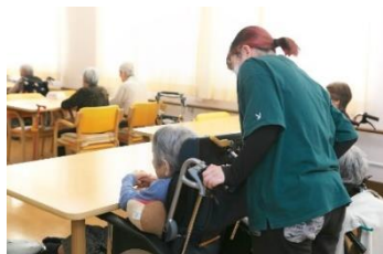
施設利用者の介護にあたる就労体験者

(株)ライフスマイルと(有)資源環境サポートの2社にて、福岡県就労支援機構に協力し、非行少年等の立ち直りの為の就労の場所として、長年にわたり携わっている。当初の不安材料として、犯罪歴のある方を採用し一緒に働き、指導等してもらえるか、問題等は起こらないかととても心配していた。しかしながら、採用した方々の前向きな立ち直りの思いが大きく、頑張ってくれたので、不安な気持ちが無くなったことを昨日の事のように思い出した。長年この就労支援に関わった職員の功労があってこそその表彰だと感謝している。