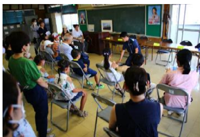
たまゆき海洋教室

この度のアワード受賞は、当協会の社会事業に対する評価として誠に光荣である。協会の綱領として、1.海を修練の場として知性ある冒険心を培う、2.健全な青少年を育てるために働く、3.美しくたむろして市民の海を確保する。さらに、2つのスローガン「海へ伸びよう！」「海をきれいに！」を基本理念に日々活動しているところである。これからも、会員全員と共に精進致す所存だ。