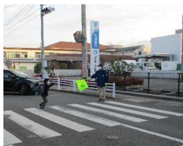
登下校時の見守り運動