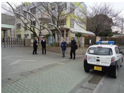
中学校卒業式における 見守り活動