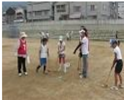
ふれあいランドゴルフ大会