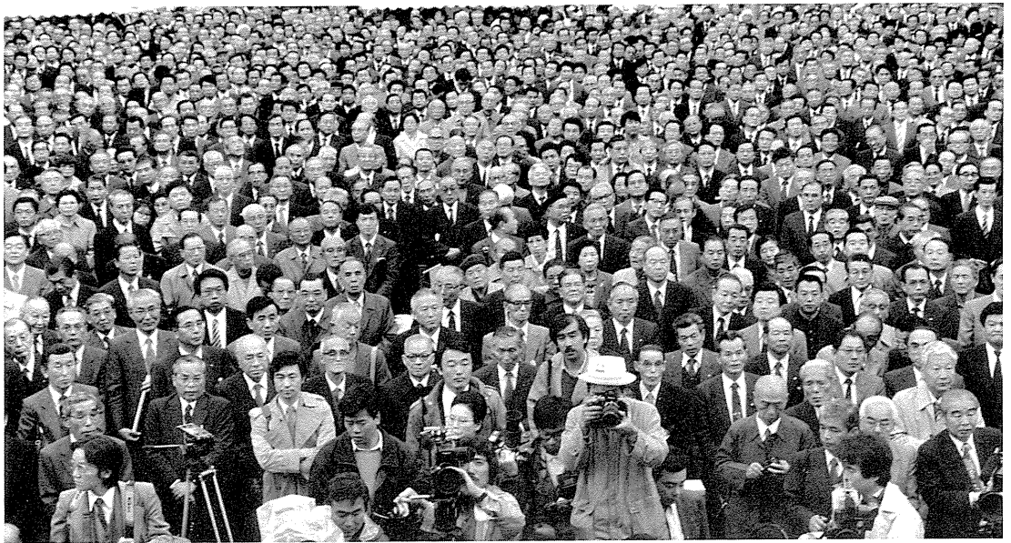
候補者の第一声を聞く有権者