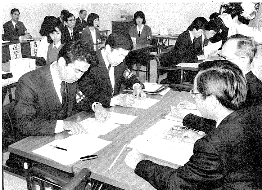
知事選挙立候補受付