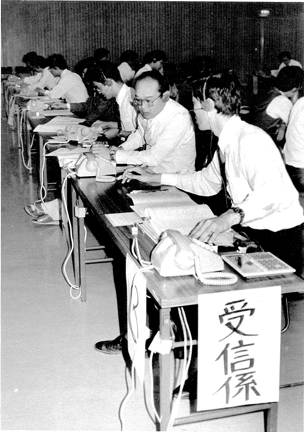
投・開票速報リハーサル