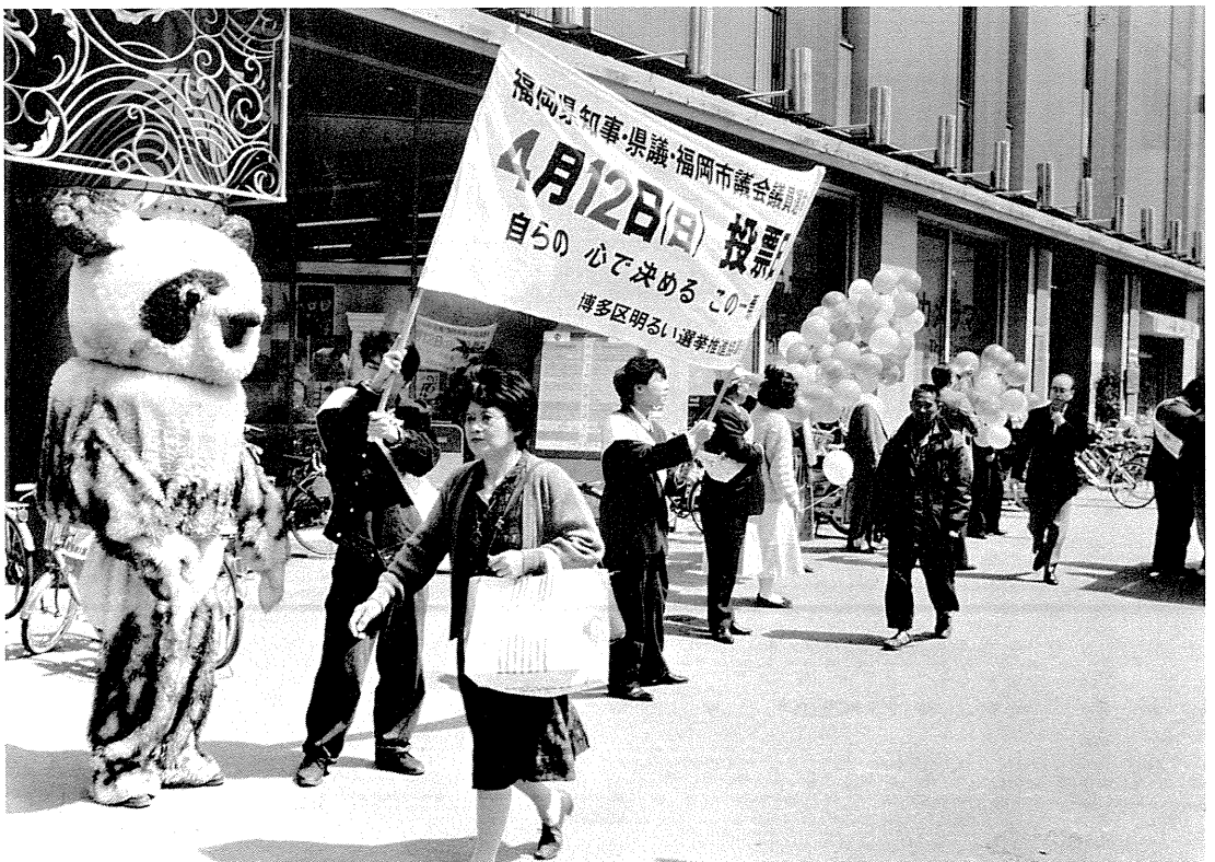
街頭啓発