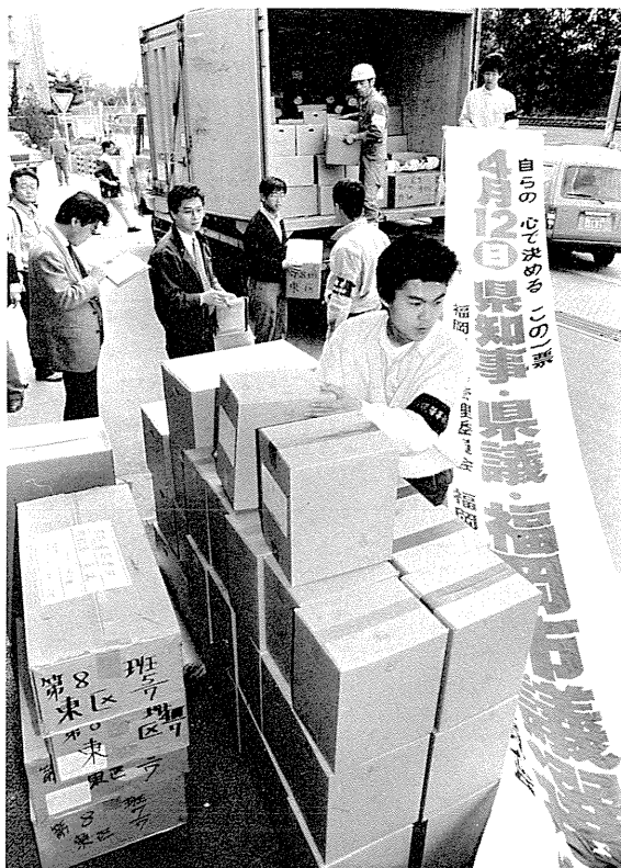
投票用紙等の発送