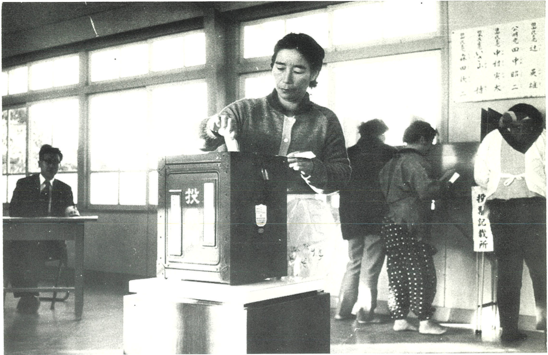
投票風景