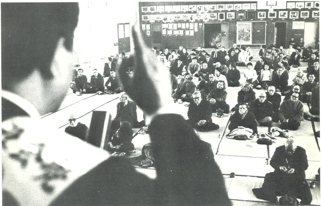
立会演説会