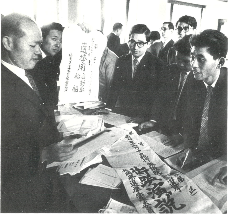
本番にそなえて立候補リハーサル