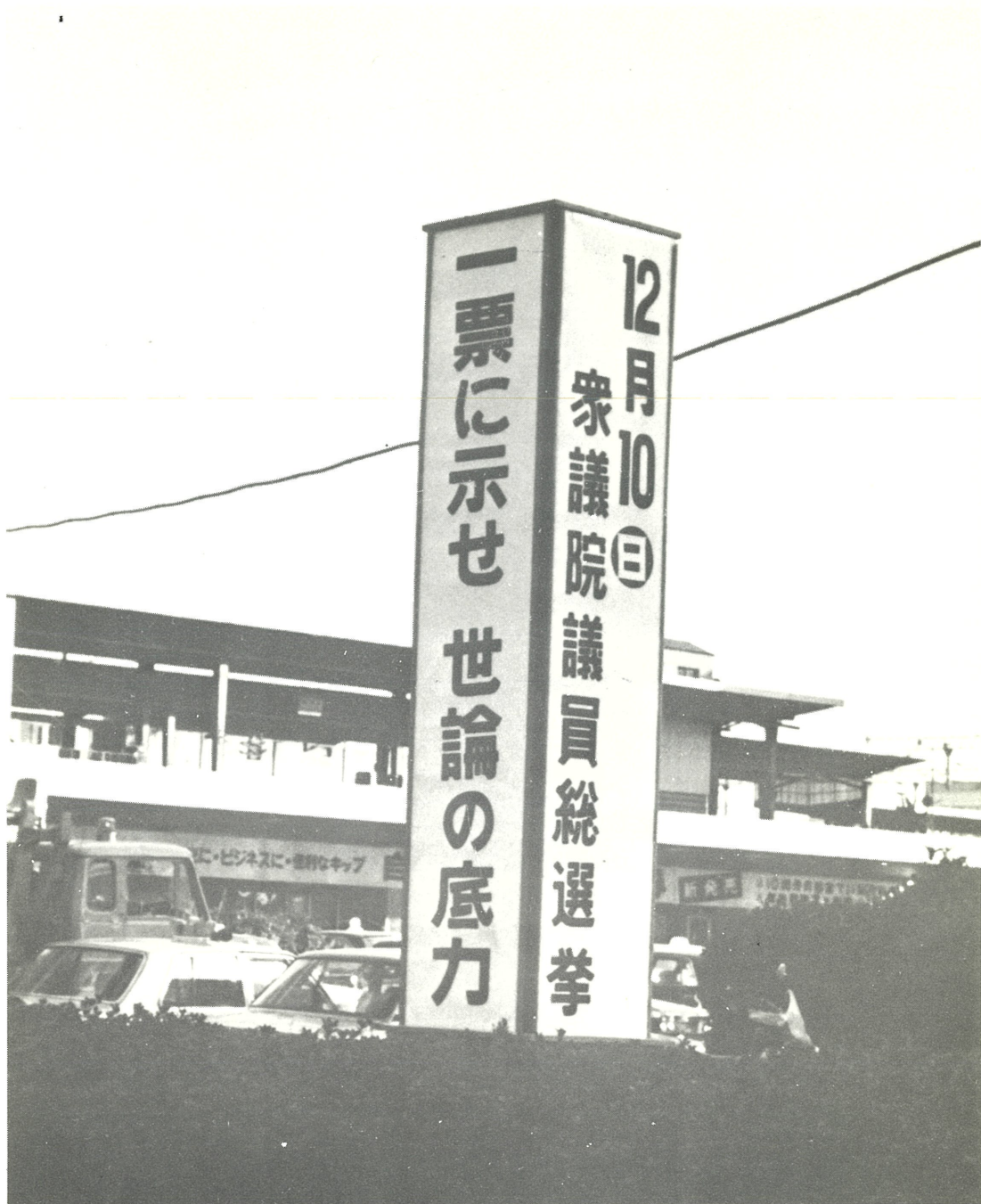
博多駅前に立てられた啓発塔