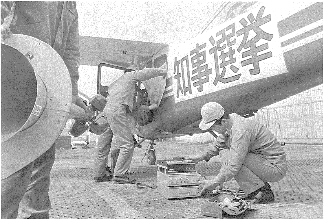
投票日を前に空と陸から投票参加を呼びかける