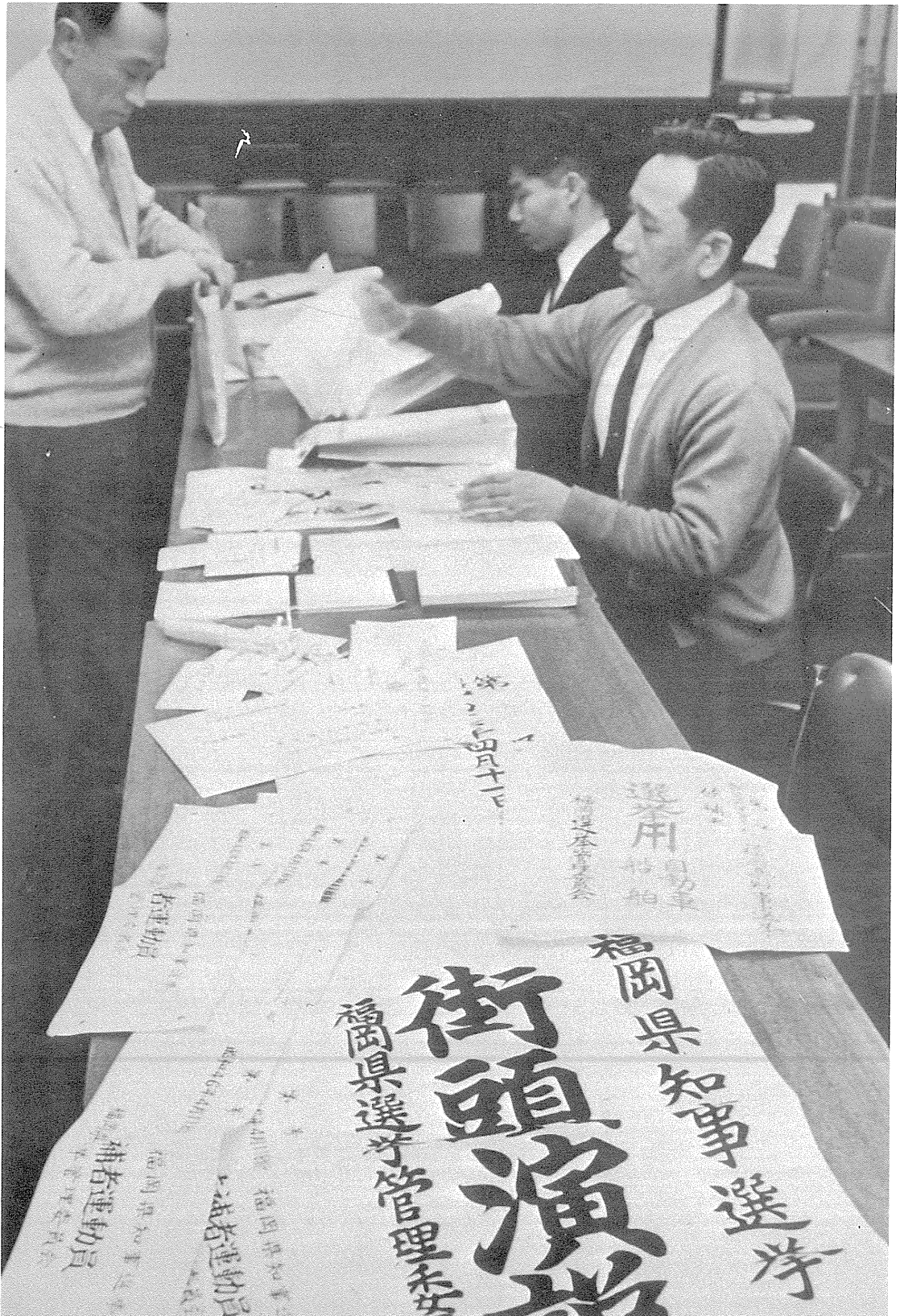
立候補受付前日交付物資の最終点検