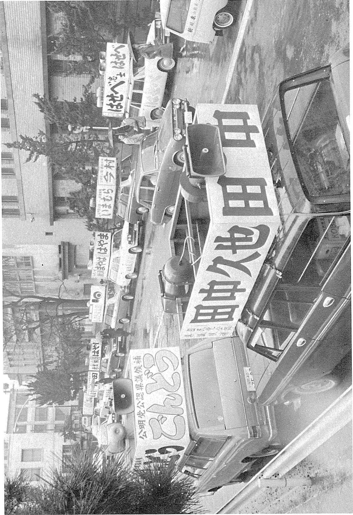
立候補届け出を待つ県議候補の選挙カー