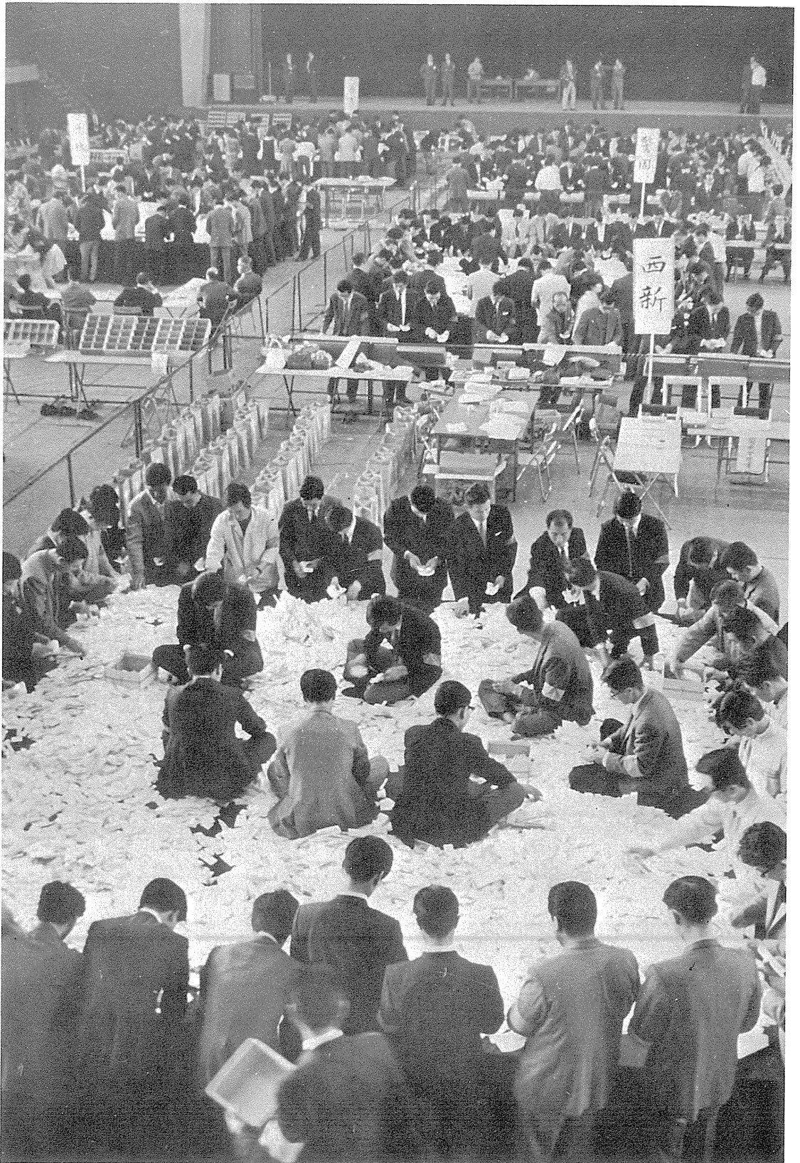
福岡市のマンモス開票