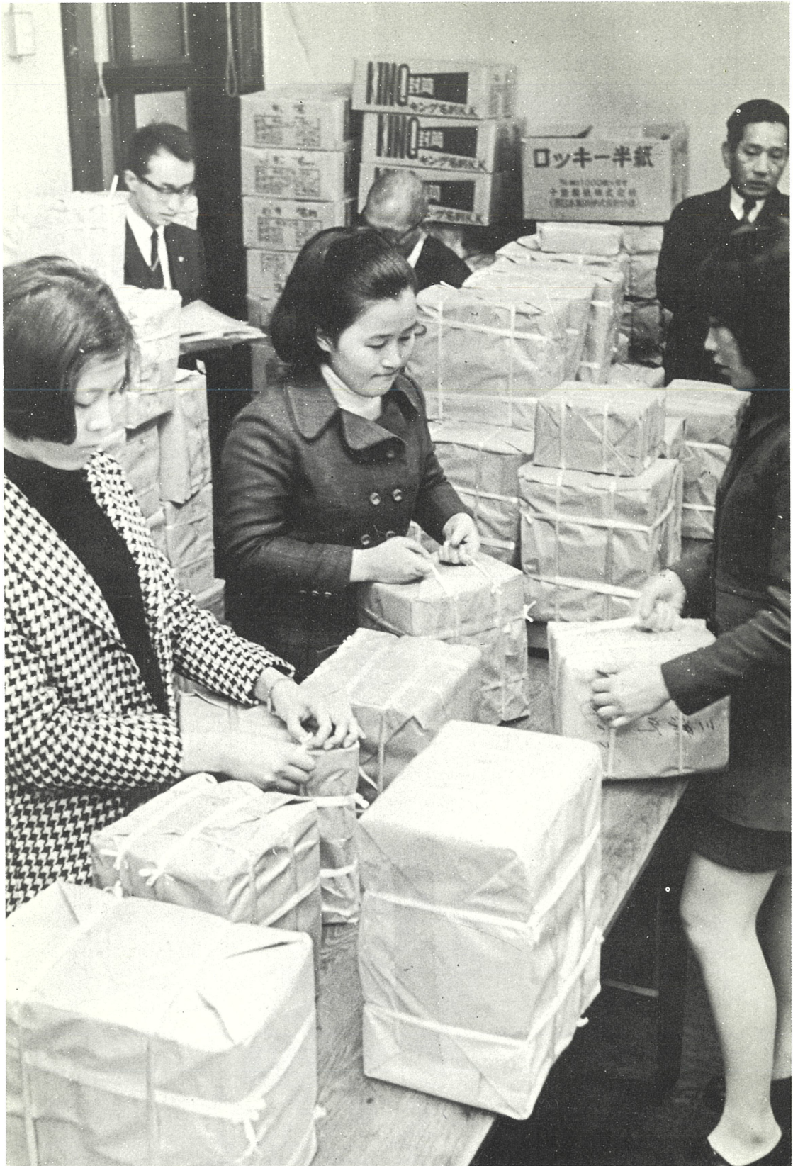
市区町村選管へ選挙関係諸物資の発送