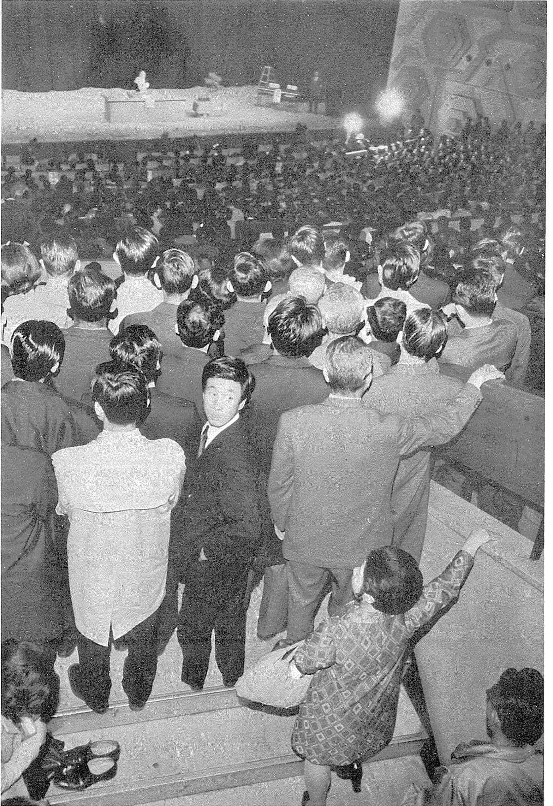
県知事選挙立会演説会（3月2日福岡市民会館で）