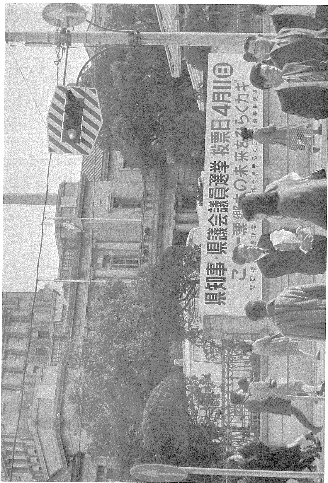
福岡県庁前の啓発看板