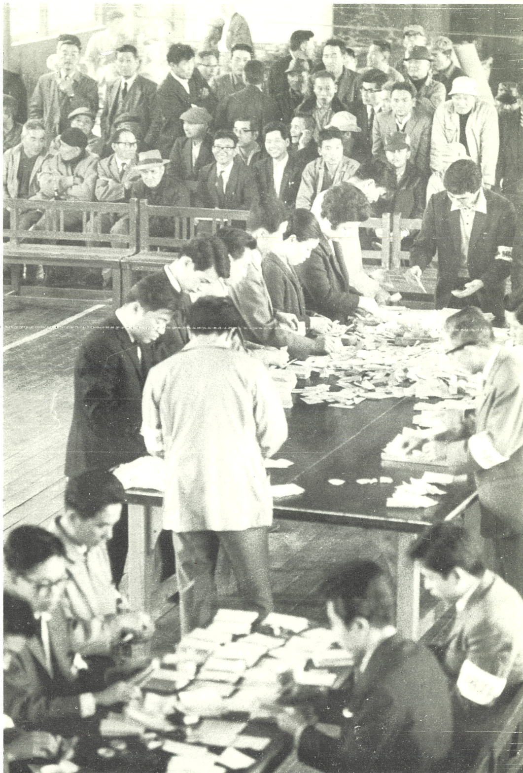
開票事務に大忙の市選管職員