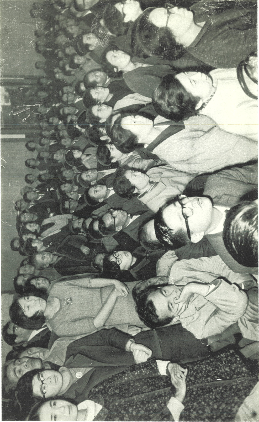
超満員の聴衆で埋まった立会演説会