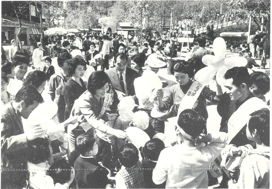
福岡県動物園で明るく正しい選挙を呼びかける県選管の職員たち