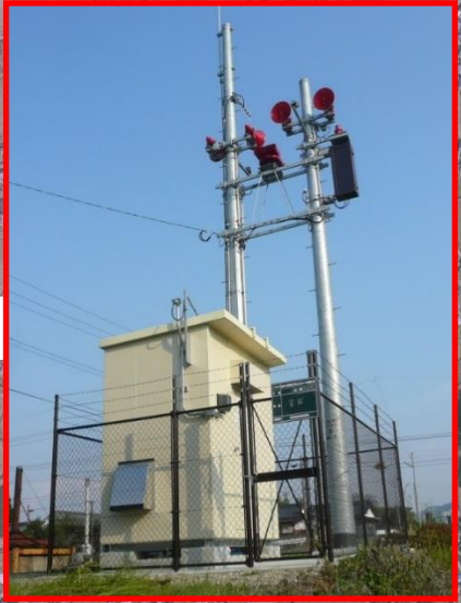
藤波ダム 警報局舎