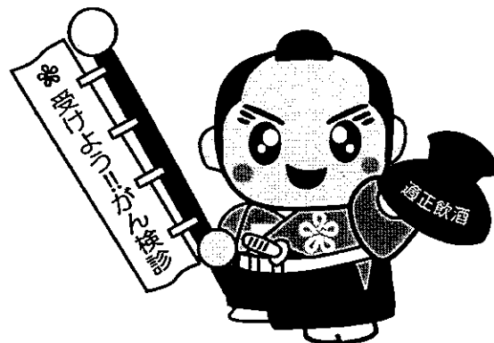
福岡県がん検診受診率向上イメージキャラクター 「検診くん」