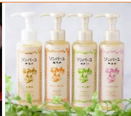
<薬師堂・ソンパーユ>