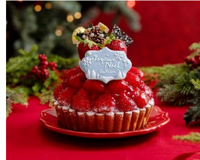
〈プライムタルト・あまおう〉