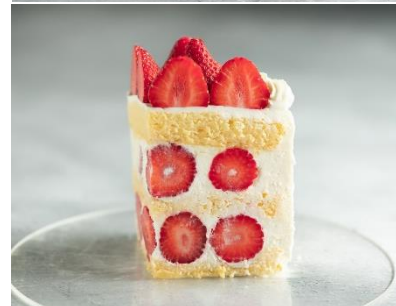
〈博多あまおうのショートケーキ〉