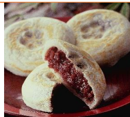
<かさの家・梅ヶ枝餅>