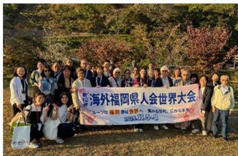
<ふるさと巡り（筑後コース）>