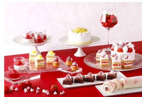
〈スーパースイーツビュッフェ〉