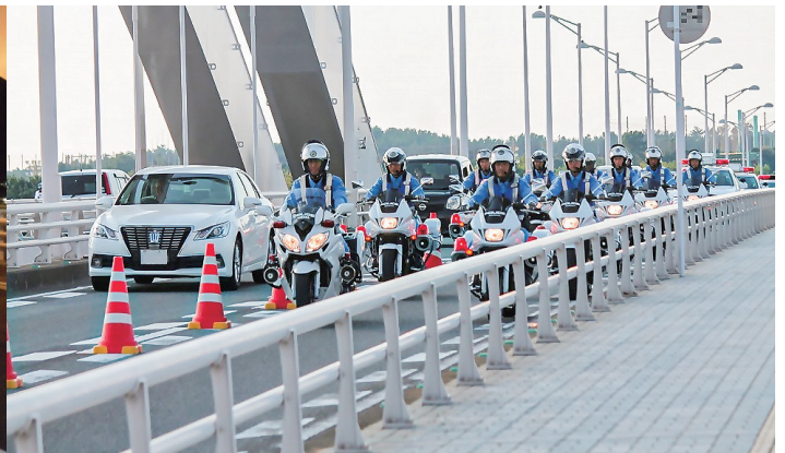
▲海の中道大橋での取り締まりの様子

飲酒運転によって、海の中道大橋で幼い3人の命が奪われた事故から20年、粕屋町で前途ある高校生2人の命が奪われた事故から15年が経ちます。私たちは、これらの悲惨な事故を決して忘れてはなりません。