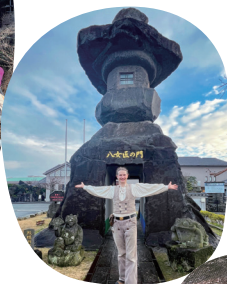
10メートル超の 石灯籠を迎える 「八女伝統工芸館」