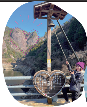
幸せの鐘が響く 世界最大級の「ハート岩」