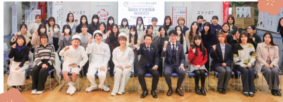
▲「福岡スマソル醤油」商品発表会の様子