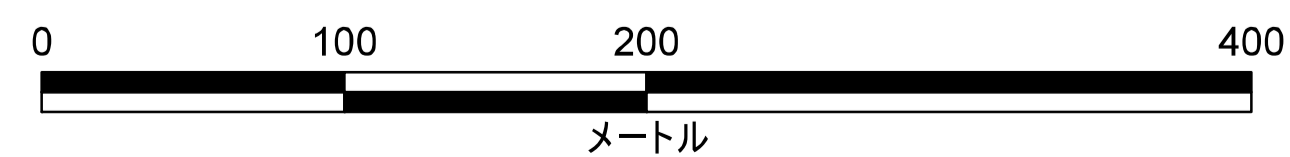
津波災害警戒区域 区域図

この地図の作成に当たっては、国土地理院長の承認を得て、同院発行の数値地図(国土基本情報)電子国土基本図(地図情報)を使用した。(承認番号 平29情使、第1125号)