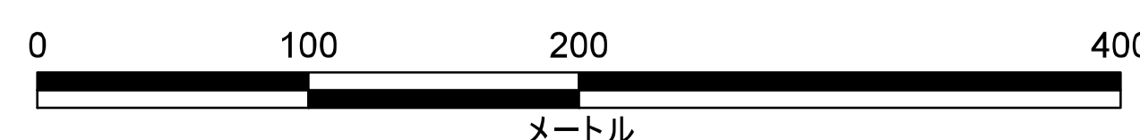
津波災害警戒区域 区域図

この地図は、大川市長の承認を得て、同町所管の測量成果を複製して作成したものである。